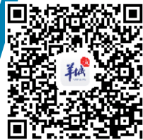
扫一扫,看“人造小太阳”视频介绍