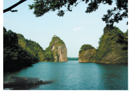
两岸奇峰如同“动物园”

《大美中国》栏目欢迎投稿。稿件要求以纪实性的图片为主,紧扣“大美中国”主题,内容不限,可人可景可物。投稿请发至邮箱:ywdmzg@163.com,并以“大美中国”为邮件标题,同时提供详细个人信息。