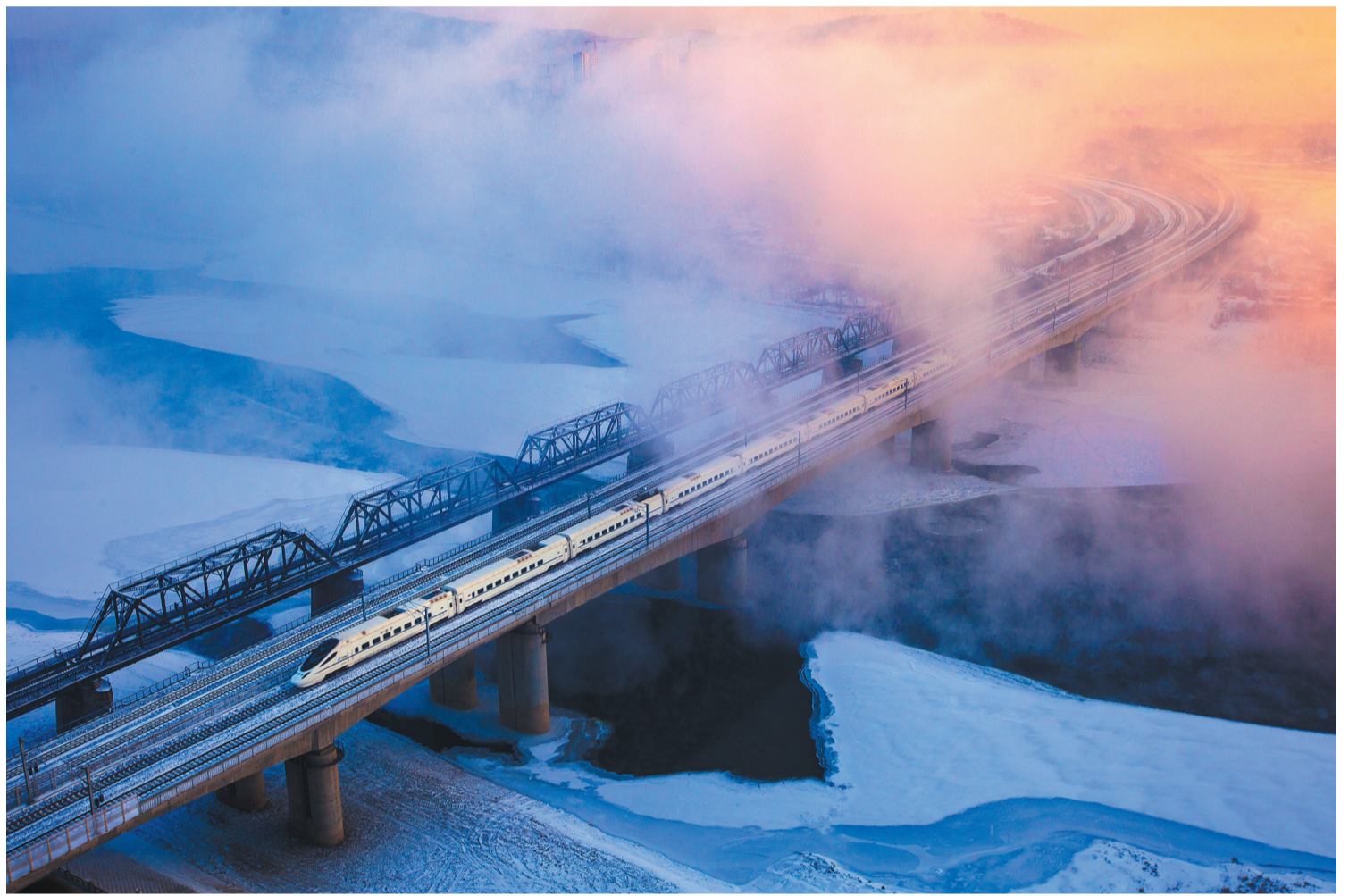
《飞越松花江》(2016年 全国铁路摄影展艺术类一等奖)