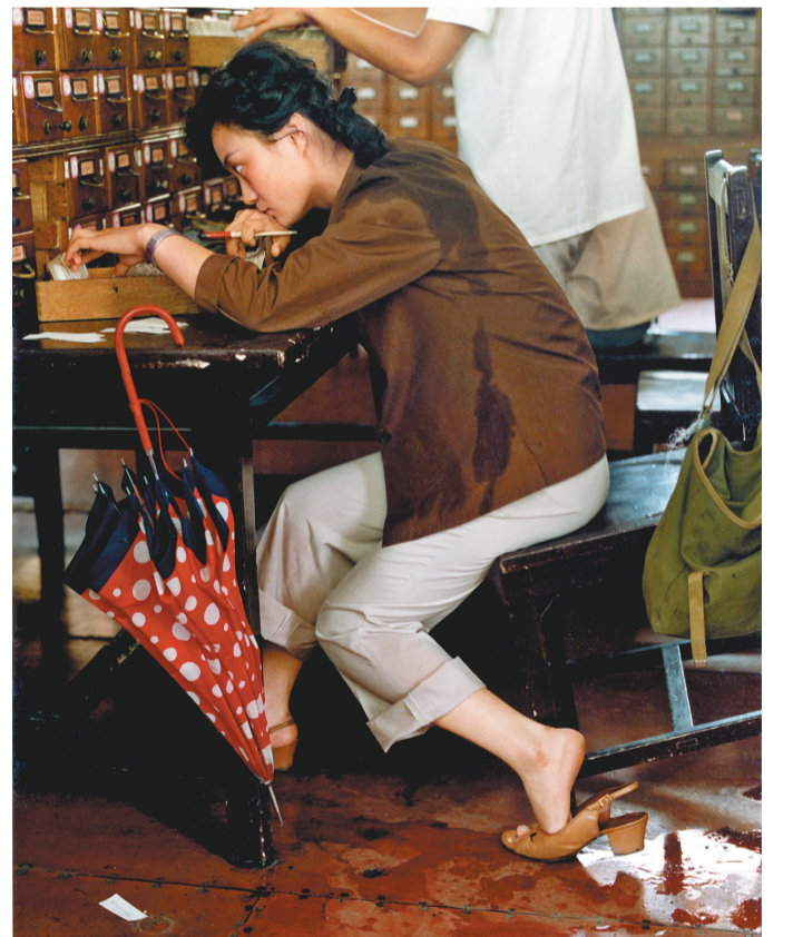
《渴求》(1984年 第十三届全国摄影艺术展银奖)