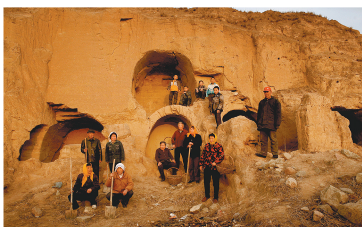
《与长城相伴》组照之一 (2014年 第十届中国摄影金像奖)