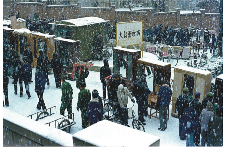
《集市》(1982年 第十九届卢森堡国际摄影比赛金奖)