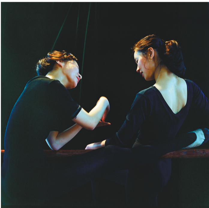
《九十九分是汗水》组照之一 (1992年 第二届中国摄影金像奖) 郑永琦