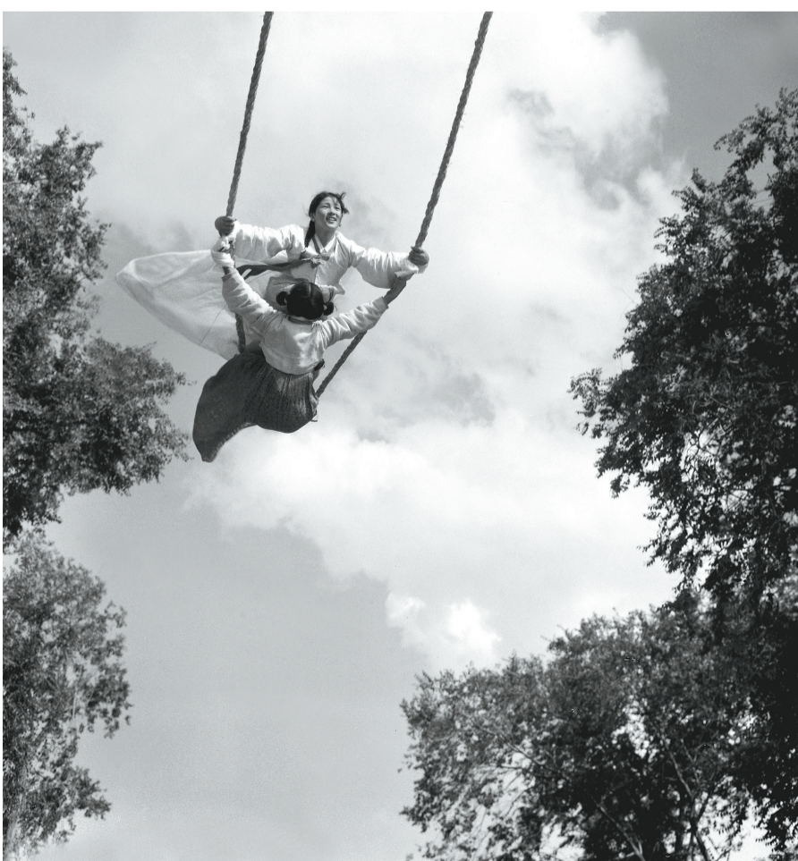
《飞燕凌空》(1980年 联合国教科文组织亚太地区第六届摄影比赛银奖)