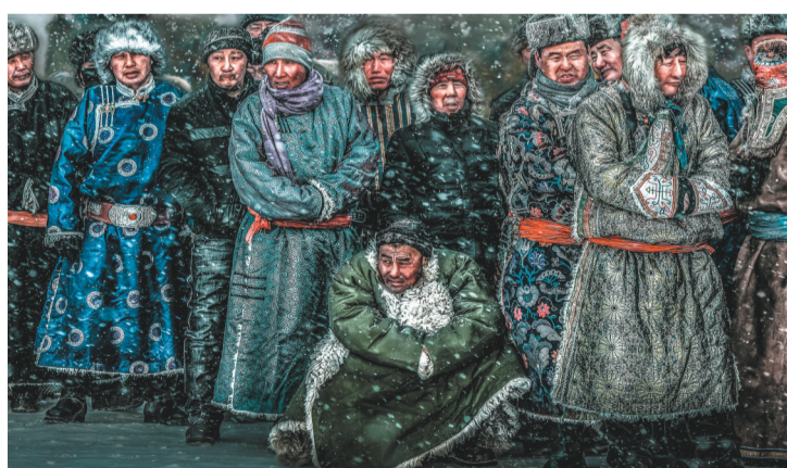
《天边的故乡》组照之一 (2015年 第25届全国摄影艺术展艺术类金奖)