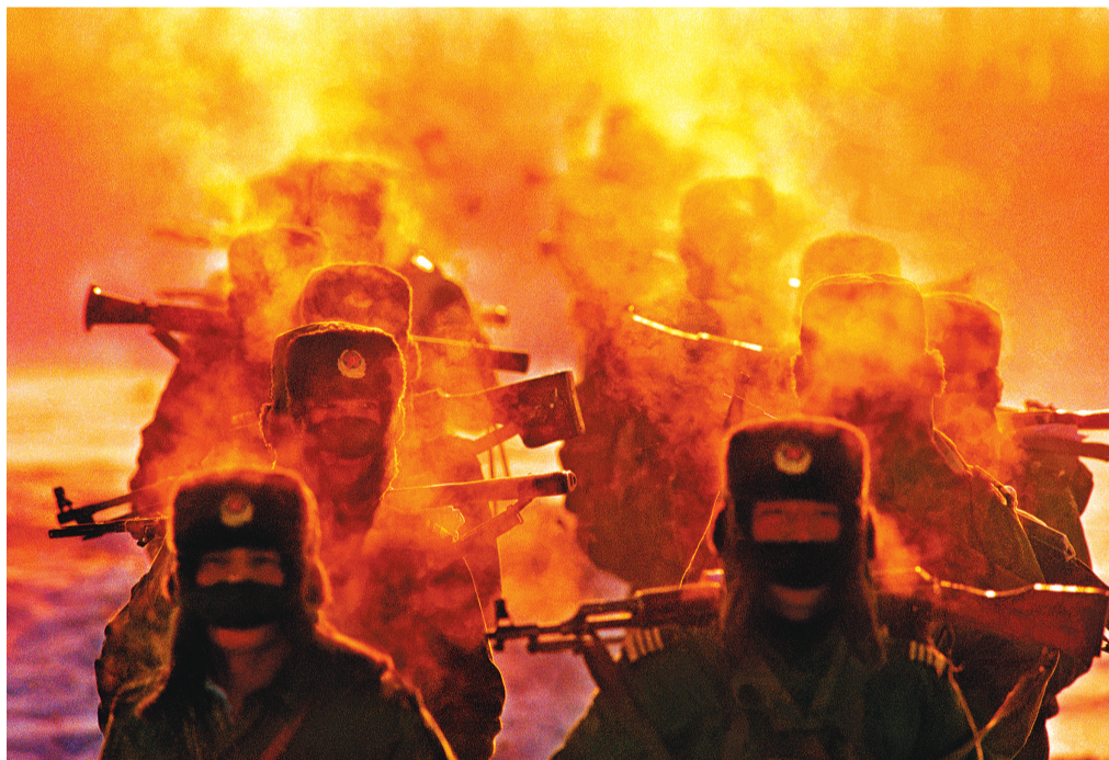
《热流》组照之一 (1997年 第三届中国摄影金像奖)