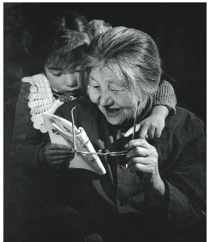
《教奶奶》(1990年 联合国教科文组织亚太地区“识字年”摄影比赛金奖)