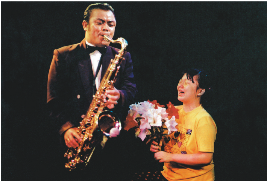
《用泪谱写的爱》组照之一 (1997年 第三届中国摄影金像奖)