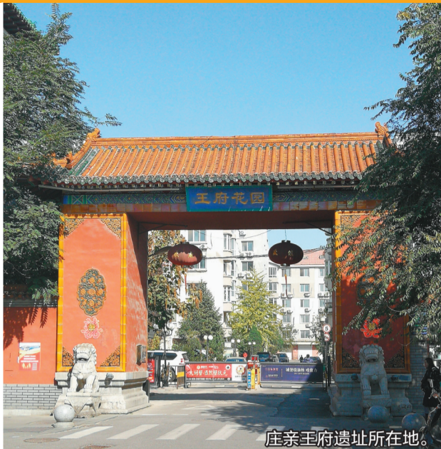
豫亲王府遗址所在地。

一座城市的历史记忆也是城市形象的重要组成部分。如果我们能站在这样的高度来思考问题，那么，很多困难便不再是困难了。