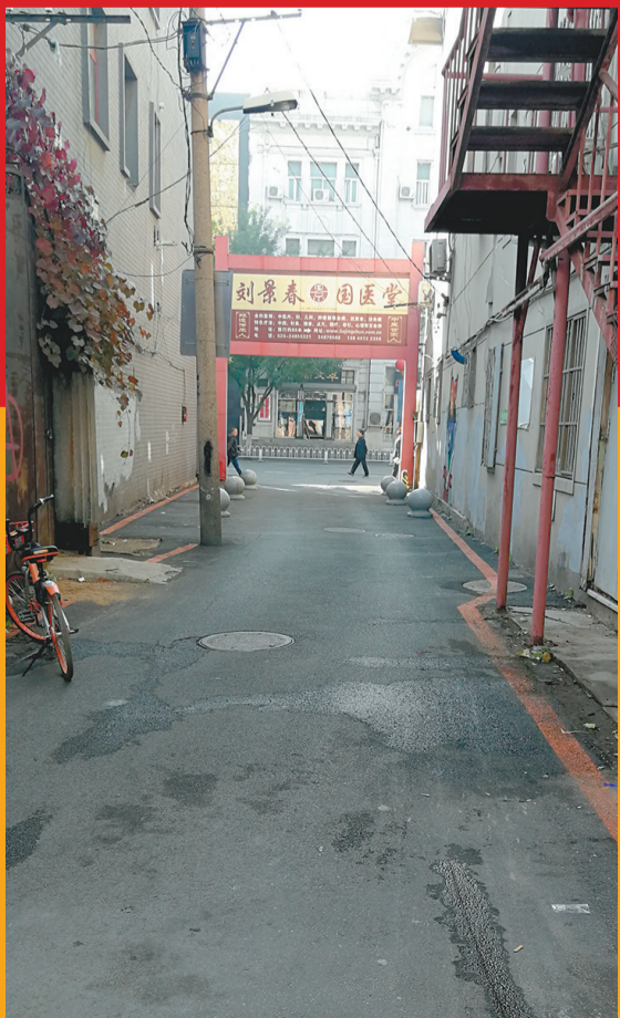
位于沈阳市沈河区沈阳路78号的饶余王府遗址。

另外，盛京城王府的建筑形制，基本由一、二进院落高台式建筑组成。其中除庄亲王府为一进院落外，其他十座王府均为二进院落。一进院落有府门三楹、正房五楹、东西配房各三楹(郑亲王府无配房)，二进院落有正寝五楹、东西配房各三楹。建筑为硬山前后廊式，都没有起楼。盛京城王府建筑是体现满州少数民族风格的二进院落组合式高台建筑群。是按照清朝规定的王府建筑规划，建筑形式统一、建筑分布与八旗驻守方位相一致的盛京城建筑的重要组成部分。