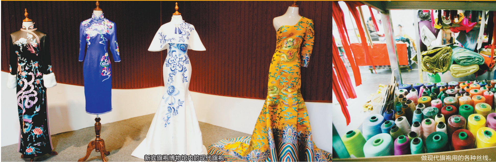
新宾旗袍博物馆内的现代旗袍。