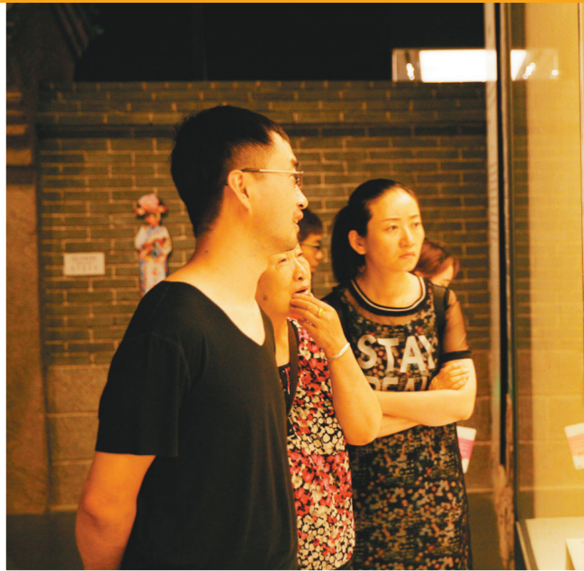
在旗袍博物馆参观的游客。