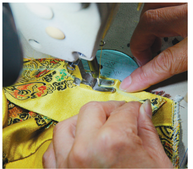
新宾旗袍手工作坊内,工人正在做旗袍。