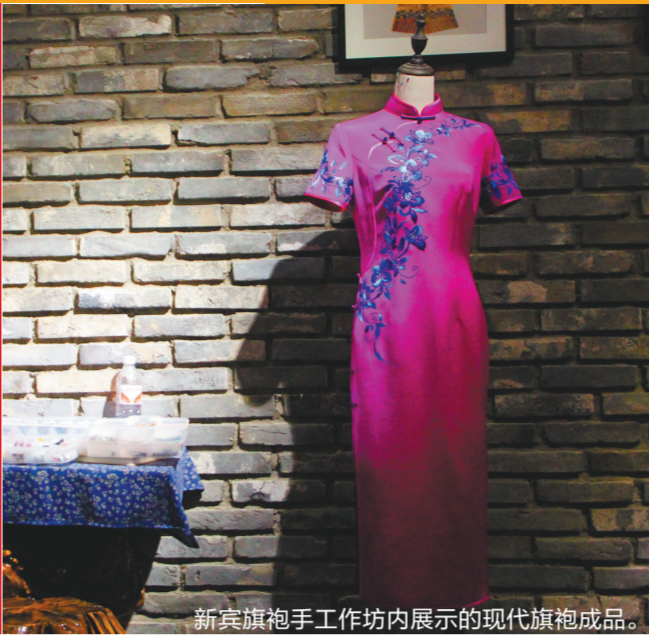
新宾旗袍手工作坊内展示的现代旗袍成品。