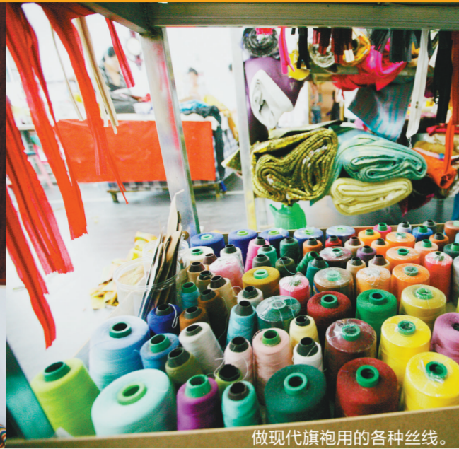
做现代旗袍用的各种丝线。