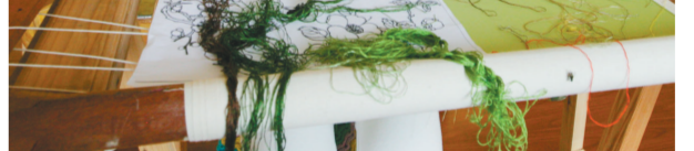
新宾旗袍博物馆内绣娘进行现场刺绣。

清史研究学者佟悦收集了大量的清代旗袍、荷包、枕头顶、帽带等实物。在这些满族服饰、荷包、枕头顶等呈现的刺绣作品上,可以看到大量使用外绣、打籽绣、衍绣、盘金绣等针法的绣品,从这种大量立体刺绣的方式中,能感受到满族先祖的国风。满懿说,盘金绣在刺绣工艺上被称为“贴线绣”,实际上这也是原始装饰方式的一种演变,是适合在皮革材料上进行的装饰方法。将动物皮条用动物筋线固定在皮革上,形成立体花纹,既符合北方寒冷地区保暖的要求,又能满足人类的审美需求。这种随材而出的工艺很自然地伴随着材料的变化而形成新的装饰风格。动物筋线变成了金银丝线,皮革材料变成了棉布与丝绸。这种绣法应用在宫廷袍服上的江江水纹,基本上占据了袍服的半壁江山,成为满族服饰的代表性标志。盘金绣与蜀绣等“四大名绣”同居天下。