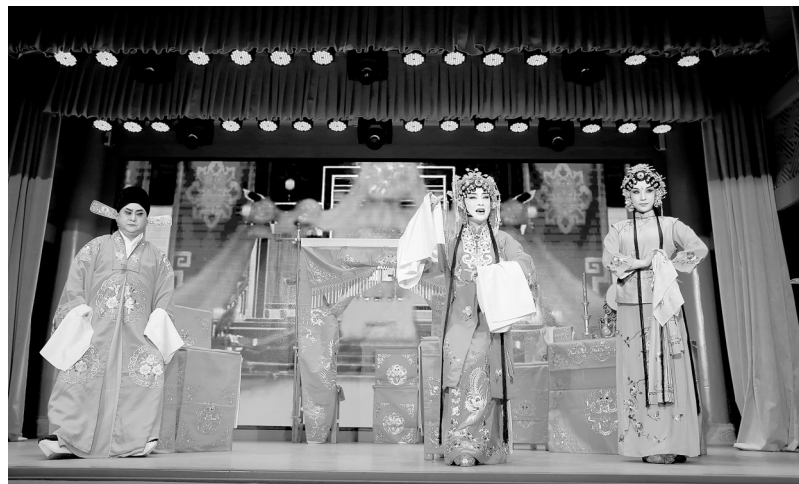
周丹(中)表演评剧《凤还巢》唱段。

此次专场展演特邀韩派评剧国家级代表性传承人、中国戏剧表演梅花奖获得者周丹献艺,演唱其代表剧目之一《凤还巢》经典唱段。当周丹登上舞台,她那清脆甜美的嗓音、细腻传神的表演,很快将演出推向高潮。来自沈阳的评剧爱好者乔阿姨兴奋地说:“我从20多岁起就迷上了