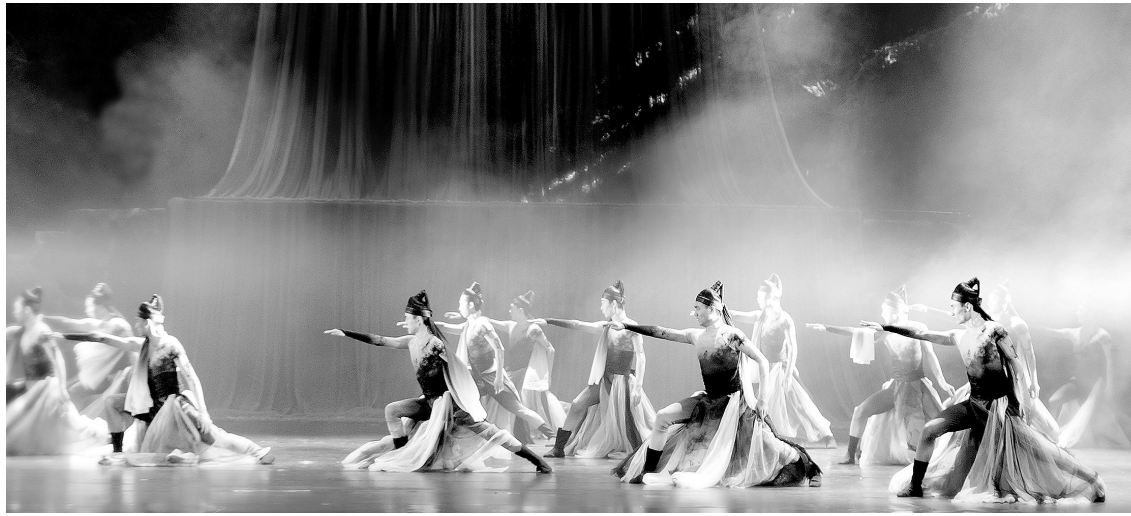
大型舞蹈诗剧《月颂》剧照。