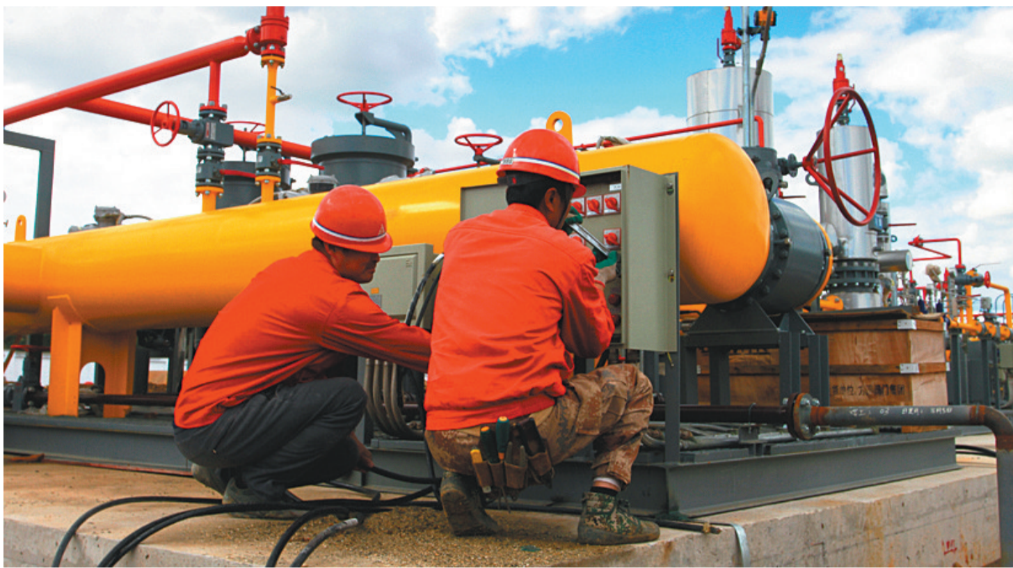
建设中的大连中路段天然气调压站。

以2月28日召开的推进大会为标志，天然气入连工程战役全面打响。大连市委、市政府坚持以人民为中心的发展思想，积极倡导“严、细、实”的工作作风，采取倒排工期、挂图作战、严格督考的过硬措施，举全市之力推进天然气入连工程建设，确保年内10万户居民用上安全、清洁、高效的天然气。