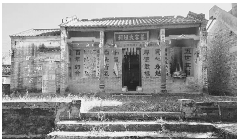
广东高要市白土镇幕村的慕容氏祠。