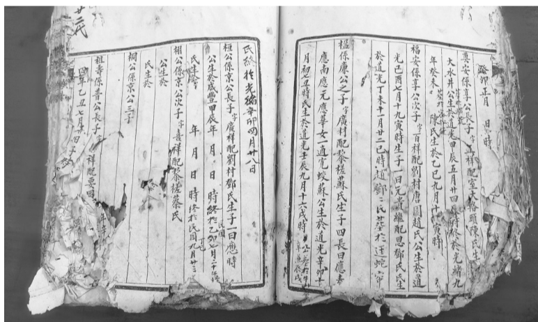
广东肇庆白土镇大旗村珍藏的慕容族谱。