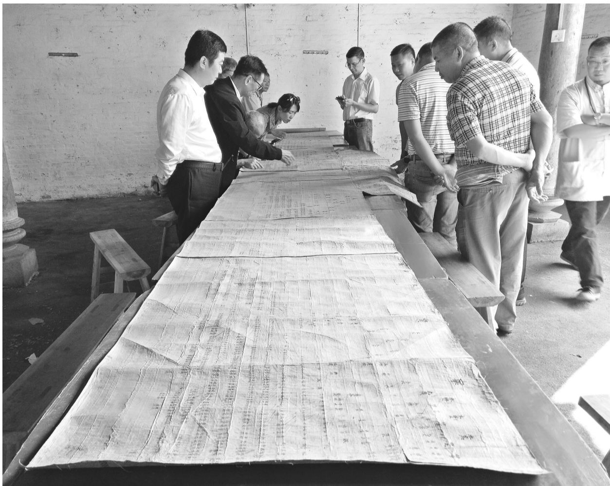
慕容后人查看慕容族谱。

核心提示 上月中旬,“全国慕容族谱编纂会议”在朝阳市举行,来自国内十余省市的60多名慕容家族代表参会,他们就家族中的历史问题进行讨论,重点是慕容姓氏的三个起源,哪个更可靠?慕容后人现居何处?慕容氏改姓为“慕”“容”“穆”等,有史料印证吗?朝阳慕容村与慕容氏有何关联?