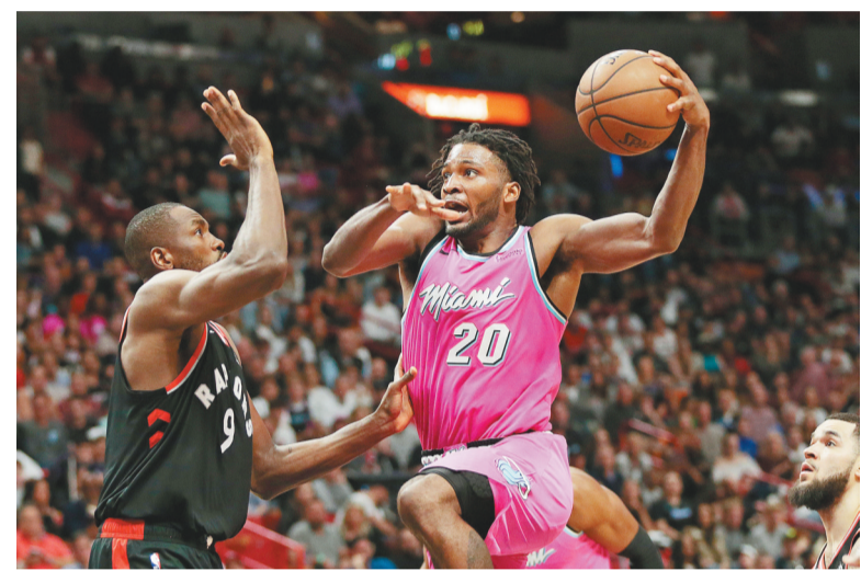
热火队球员温斯洛(右)在比赛中带球上篮。

本报讯 记者黄岩报道 26日NBA常规赛，猛龙以106:104客场险胜热火，热火在领先17分的情况下被逆转。