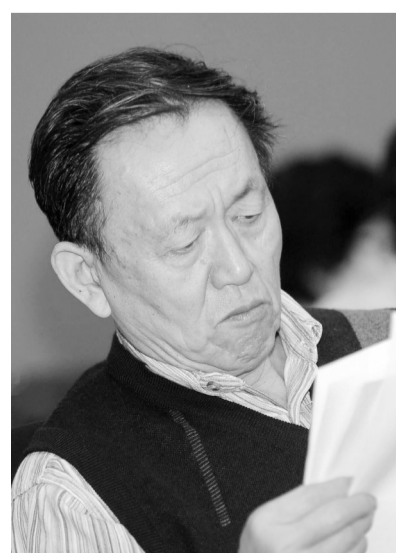
据新华社广州1月9日电（记者魏蒙）当过兵，当过工人的蒋子龙，在

40年前，就以《乔厂长上任记》揭示了改革开放之初的种种矛盾，剖析了不同人物的复杂的灵魂，塑造了一位敢于向不正之风挑战、勇于承担责任，具有开拓精神的改革者的形象，表达了当时人民渴望变革的迫切要求。