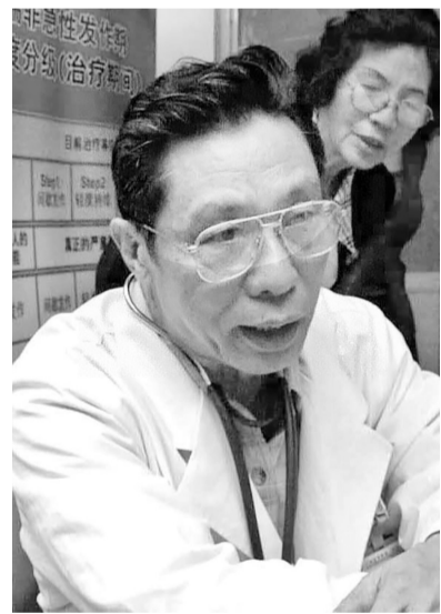
据新华社广州1月9日电（记者刘大江 邓瑞璇）广州市呼吸疾病研究所，广州医科大学附属第一医院

国家呼吸系统疾病临床医学研究中心原主任、中国工程院院士钟南山的工作地。16年前，一场没有硝烟的战争席卷全球，这里曾是战场的前沿阵地。时年67岁的钟南山，就是一名牢牢坚守的战士。