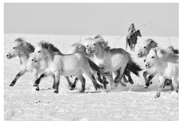
时下正值草原冬季旅游旺季，内蒙古自治区西乌珠穆沁旗的牧民们在雪原上一展身手，为游客展现独特的民族风情。图为1月8日，牧民进行套马表演。