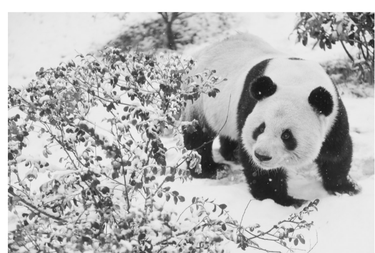
1月9日，在合肥野生动物园，大熊猫“亮亮”在户外活动。当日，安徽省合肥市迎来降雪。合肥野生动物园里的大熊猫“亮亮”在雪地里进食、玩耍，享受戏雪的快乐。