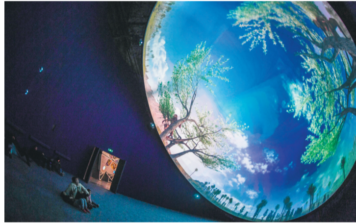
1月31日，观众在浙江自然博物院内观看立体电影。临近春节，位于浙江安吉县的浙江自然博物院迎来大批观众，拥有丰富展品的博物院成为孩子们寒假期间的好去处。