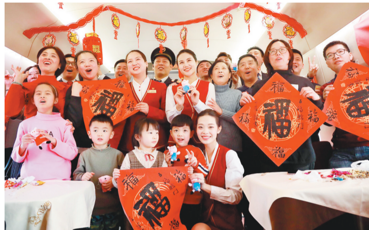
2月1日，演出结束后，铁路职工与旅客合影。当日，在北京至北海的G529次列车上，铁路职工准备了列车联欢会，让旅客在欢声笑语中度过温馨的旅程。G529次列车是全国运行时间最长的高铁列车。