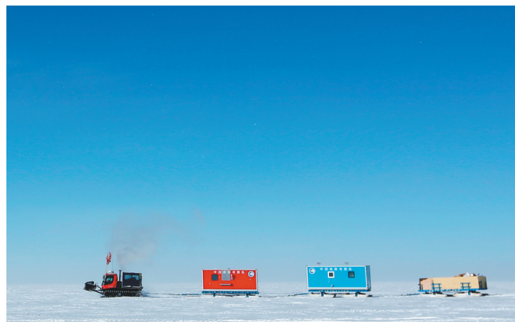
中国南极科考队昆仑队科考队员离开昆仑站，开始撤离南极冰盖高原。图为车队在行进途中(1月24日摄)。