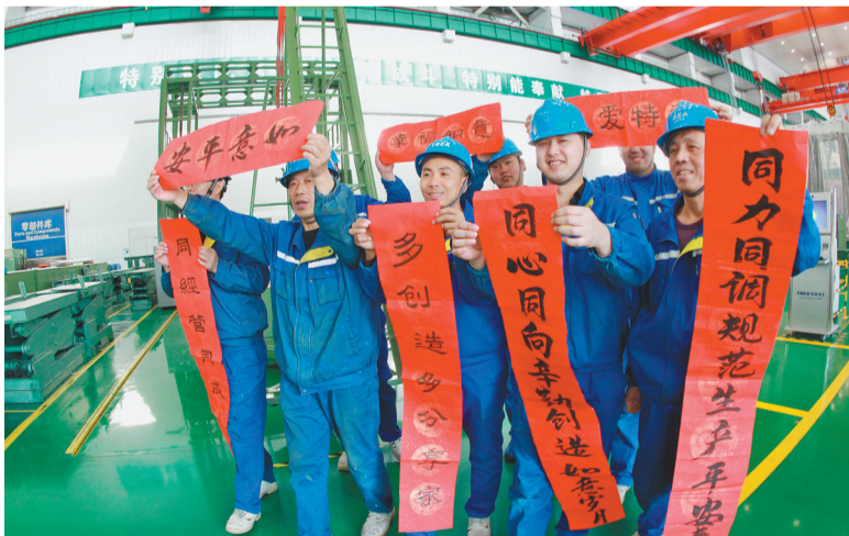
上图:2月2日是腊月廿八，在山东省邹平市黛溪街道年货市场，一位市民拿着购买的“福”字回家。