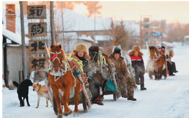
1月25日，在黑龙江省漠河市北极村，马队载着游客去神州北极广场“找北”。位于我国最北端的黑龙江省漠河市北极村，每年都迎接全国各地的大量游客到这里“找北”。