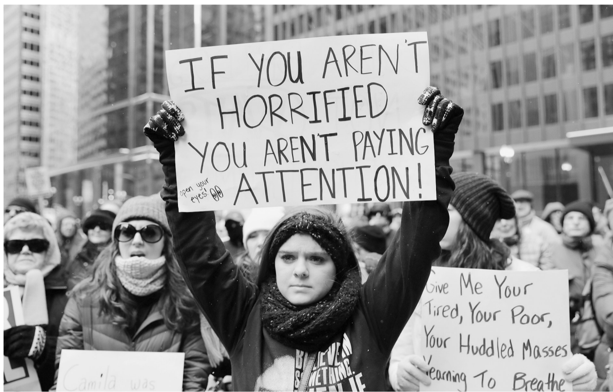
2月18日,在美国芝加哥,人们参加反对特朗普边境安全政策的游行。

美国16个州18日联合提起诉讼,指控总统特朗普通过宣布“国家紧急状态”以绕过国会筹集经费建造边境隔离墙的做法违反宪法,要求法院予以“叫停”。尽管特朗普宣布“国家紧急状态”后赶上“总统日”小长假,但这一决定已在政界、司法界激起强烈反弹,美国政坛后将围绕“造墙”展开新一轮博弈。