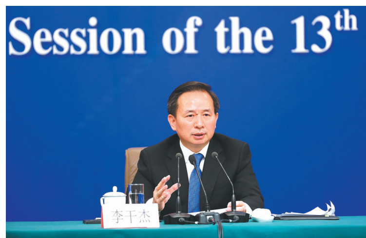
图为李干杰回答中外记者提问。