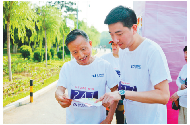
工作人员向百姓讲解如何选择理财产品和防范风险。(资料片)