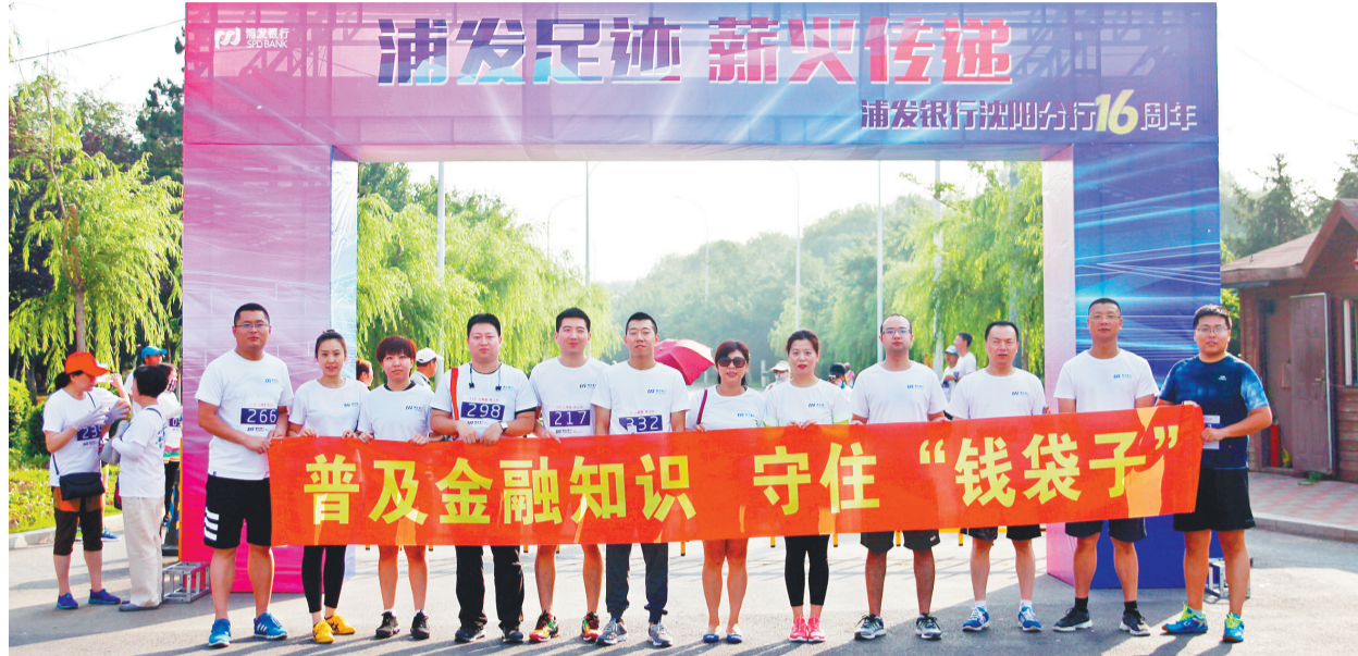
浦发银行沈阳分行开展普及金融知识、守住“钱袋子”主题长跑活动。(资料片)

核心提示 为维护消费者合法权益,进一步提升消费者权益保护意识,浦发银行沈阳分行组织全辖网点开展了“3·15金融消费者权益日”系列宣传活动,在阳春三月为金融消费者送去一缕温馨的春风。