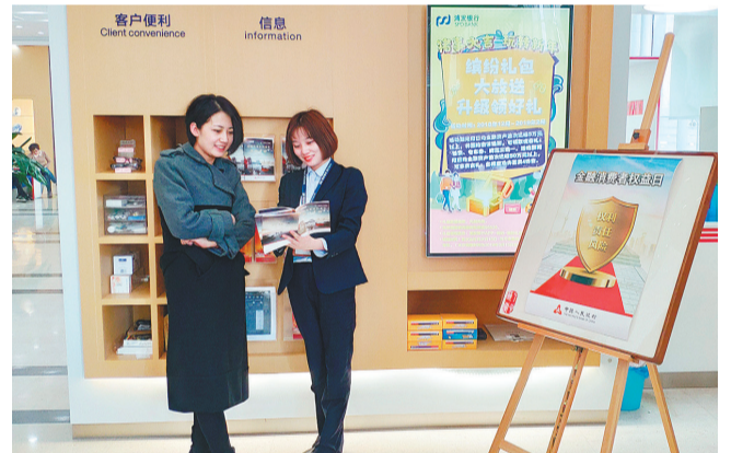
在营业大厅设置便民角,推广普及消保常识。