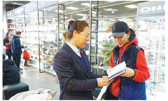
工作人员向消费者介绍“防范新型电信网络诈骗”消保知识。

质量、完善双录机制、开展金融知识宣传教育活动、配合警方开展打击和防范电信网络新型违法犯罪活动等措施保护消费者合法权益。为有效防范误导销售、私售“飞单”等行为,沈阳分行对理财业务实行销售专区录音录像管理,切实维护消费者合法权益。