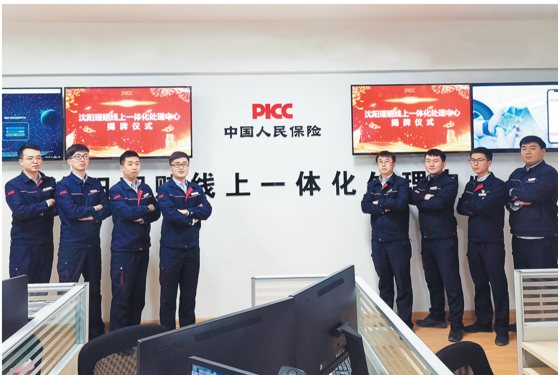
人保财险沈阳市分公司理赔线上一体化处理中心。

此次人保财险沈阳市分公司理赔线上一体化中心的成立,是协同公安交管深化“放管服”改革、对前期警保联动合作的深化和延伸,是积极推进人保数字化战略落地,不断提升人保理赔服务能力和客户体验的重要实践。人保财险沈阳市分公司将承担社会责任、服务民生作为公司经营根本。通过自身的品牌价值、机构网点的先天优势,更好地承担政治责任和创新服务,以保险理赔新机制,为广大客户,为社会提供更专业、更全面的服务保障。