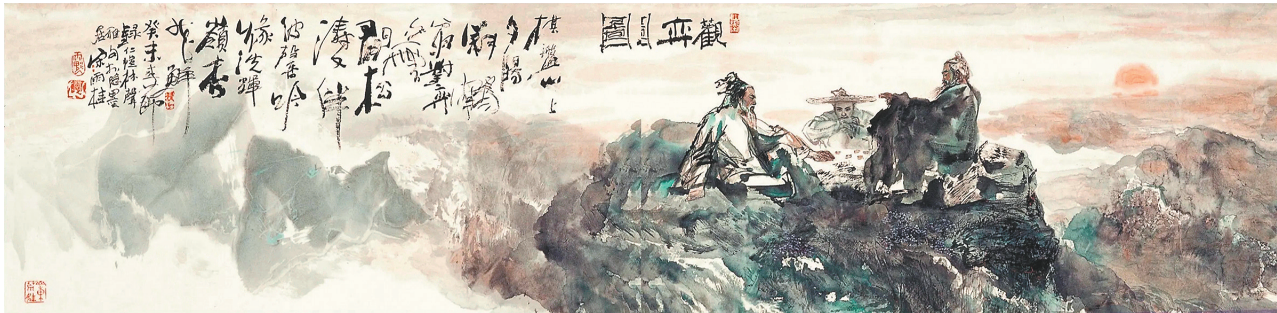
《盛京演义》之棋盘山传奇

核心提示 辽宁美术作品在全国美展中的获奖量一直位居前列,其中,连环画创作是辽宁强项,从1980年第五届全国美展起,均有作品荣获各级奖项。2004年第十届全国美展中,《盛京演义》荣获连环画最高奖。本报“国展辽画”专栏为读者详细解读荣获全国美展的佳作,在绘画中了解历史,激发奋发精神。