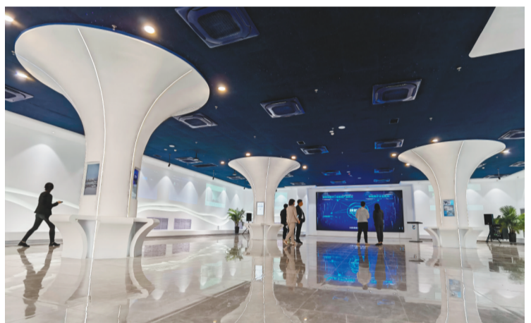
来自部分医疗企业的代表参观一方天医疗大数据产业园。

构建创新指标体系。沈抚示范区以工业高新技术产业占比、规模以上工业总产值超40%、研究与试验发展(R&D)经费投入强度超2.5%为近期发展目标,以引进