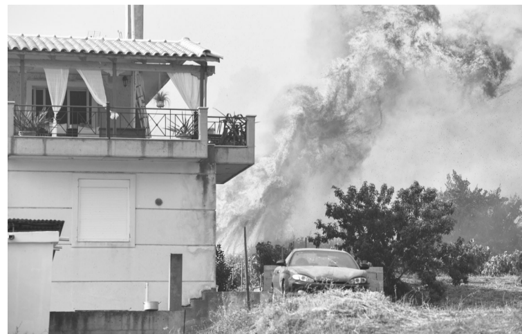
这是7月24日在希腊古奥林匹亚南的一个村庄附近拍摄的火焰与浓烟。