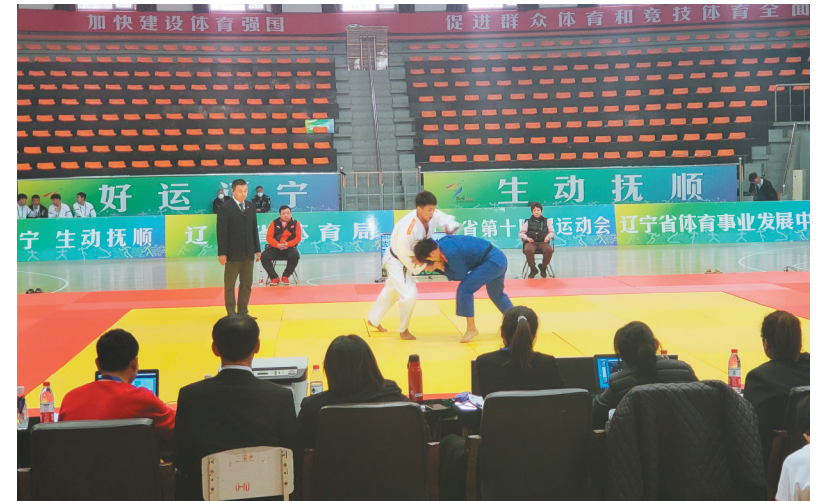
辽宁省第十四届运动会青少年组柔道比赛现场。

3月22日,辽宁省第十四届运动会青少年组柔道比赛在抚顺体育馆火热举行。作为本届省运会承办城市,抚顺将承办11个大项的比赛。其中,柔道比赛率先开赛,共设置U19、U17、U15三个年龄段6个组别,吸引了沈阳、大连、鞍山、抚顺、朝阳、葫芦岛等地14支柔道队伍300多名青少年运动员参赛,将产生38枚金牌。