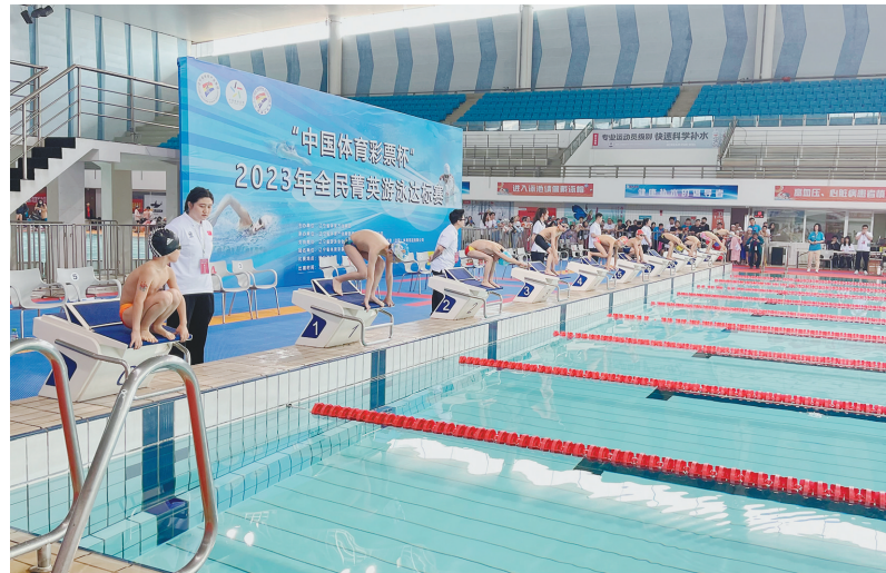
在“中国体育彩票杯”全民菁英游泳达标赛比赛现场,参赛小选手们准备出发。

随着裁判发出指令,小选手们鱼跃入水,滑行、摆臂、打水……大家都努力在泳道内展现出自己的最佳水平。看台上的小选手家长和游泳