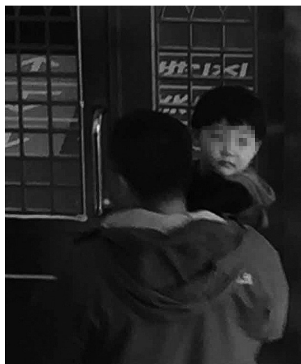
胖胖的家人来到派出所把孩子接走了。

昨日上午9时许,记者联系上沈阳市公安局沈河分局风雨坛派出所韩所长,他向记者介绍了大概情况。8日晚8时30分许,风雨坛派出所民警接到110指挥中心的指派,“在青年公园附近有一个小男孩独自来回走。”随后,民警赶到