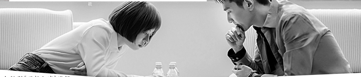
电视剧《理想之城》海报