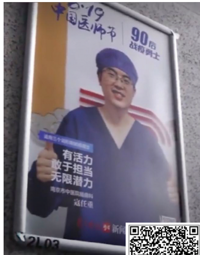
▲本报医师节海报 ▶扫码看视频新闻