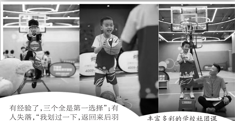
丰富多彩的学校社团课

近日,南京即将开学,学校开学的各项工作也陆续展开。又到了一年一度的“抢课季”,你抢到了心仪的课程了吗?抢课的过程又有哪些趣事呢?这些秒光的社团课程对于“双减”之后的课后服务又有哪些借鉴意义呢? 扬子晚报/紫牛新闻记者 王颖