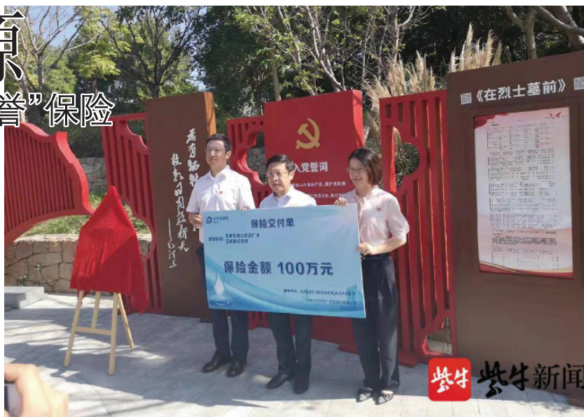
纪念设施保护管理,充分发挥辖区纪念设施红色教育主阵地作用,大力宣传弘扬英烈事迹精神,全力打造多领域跨界融合、各层级优势互补、全区域高效协同的退役军人服务