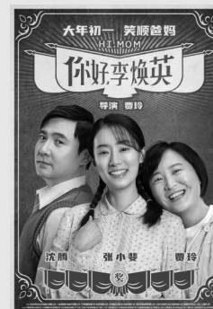
20:15 你好李焕英 (央视六套)