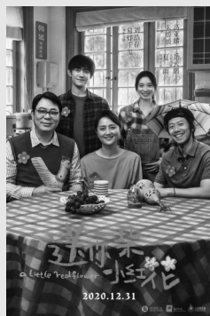
20:15 送你一朵小红花 (央视六套)

2015年,他编著出版的《奇石收藏与健康》,受到广泛好评,最近完成的《雨花石鉴赏学》专著由江苏科技出版社出版,在书中他首次提出建立并研究雨花石鉴赏学的建议。