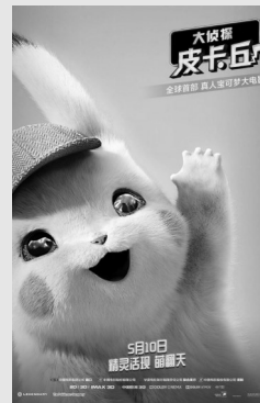
22:43 大侦探皮卡丘 (央视六套)