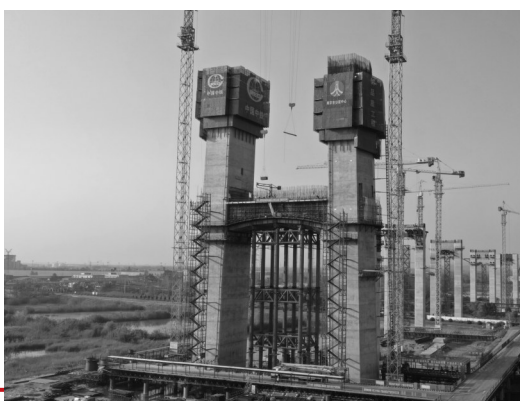
仙新路长江大桥北塔正在“长高”