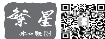
扫描二维码,敬请关注本报专副刊公众微信号“B座西窗”,也可在微信“添加朋友”中“查找公众号”,搜索“B座西窗”或微信号“bzuoxichuang”。

一年又一年,那些曾经的悸动慢慢沉淀为美好的回忆。每当桂花盛开时,我总会念起记忆中的花香,那是年少时的岁月芬芳。