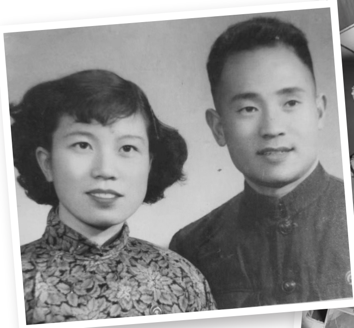
▲爷爷和奶奶的旧照