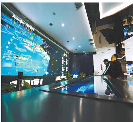
2017年5月,香河智慧城市指挥中心正式落成启用,上线项目围绕政府管理与便民服务展开,对公共交通、公共服务、健康医疗等数据进行采集、监测和处理。