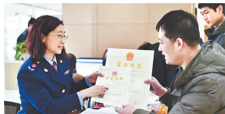
今年1月,香河县便民服务中心正式营业,把县直30家部门以及315项事项全部统一纳入便民服务中心,大大方便了企业和百姓。

化解信访矛盾,更加注重运用四种形态,更加注重制度体制创新,及时发现问题,堵塞漏洞,健全机制,预防腐败,为推动高质量发展提供了坚强的政治保障。