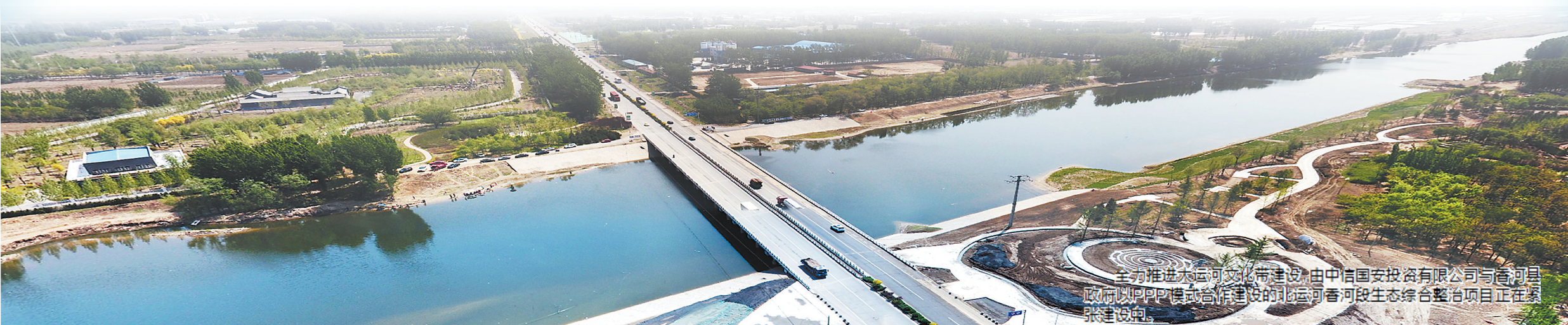
全力推进大运河文化带建设,由中信国安投资有限公司与香河县政府以PPP模式合作建设的北运河香河段生态综合整治项目正在紧张建设。