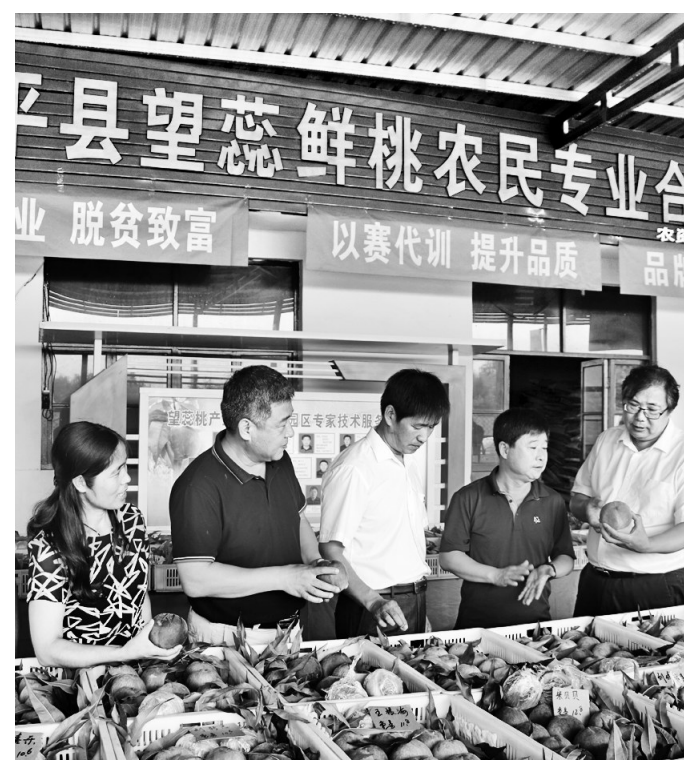
8月26日,顺平县百余位桃农带着自家招牌产品,参加由顺平县望恋鲜桃现代农业园区、台乡桃产业协会联合举办的桃评比交流会。目前,顺平县桃树种植面积达14万亩,产值逾5亿元,成为名副其实的富民产业。

本报讯(通讯员贾同温 记者寇国莹)近日,保定市13个观光采摘果园被省林业厅确定为河北省级观光采摘果园,评定数量位列全省第一。 这13个省级观光采摘果园分别是满城县金翠种植养殖专业合作社、易县绿泽农林果种植专业合作社、唐县和乐园家庭农场、唐县沃盛农业开发有限公司、唐县胜鹏