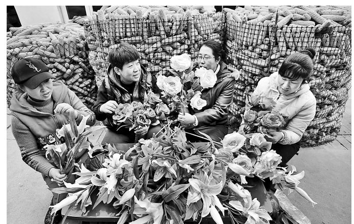
近日,宣化区顾家营镇黄家堡村村民在家中制作仿真花。该村引进仿真花来料加工项目,让村民利用闲暇时间便可实现增收。目前,该项目已经带动200多人从事仿真花加工,人均月增收2000元。

河钢宣钢坚持以推进技术进步和管理创新为有力支撑,从开展岗位创新活动、搭建科技创新平台等多方面调动人们的创新积极性,涌现出新型装载机轮胎保护链用钢及其生产方法、复热式炼焦炉置换加热操作方法等优秀发明专利,持续提升竞争力、增强综合实力奠定基础。