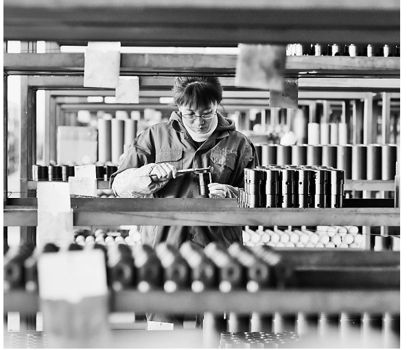
近日,在唐山新兴制造园区,金石钻探(唐山)股份有限公司职工在对产品进行出厂前的检测。该公司研发生产的地质岩石钻探钻具销往多个国家和地区。唐山新兴制造园区是唐山市未来重要的产业聚集区和增长极。近年来,唐山市加速优质产业项目向园区聚集,扩展了企业发展空间。

以承办唐山市第三届旅发大会为契机,加快推进滦州百年评剧艺术馆、滦河大铁桥工业遗址等项目建设,完善旅游交通网、旅游服务网、智慧旅游平台等配套服务功能,推动东部滦河文化产业带建设。以吉祥蔬菜 获评省名优产品、滦州花生 入选省首批特色农产品优势区为契机,发展科技农业、绿色农业、品牌农业、质量农业,打造覆盖古马镇、小马庄镇、雷庄镇、南部现代农业产业带。支持鸡冠山现代农业生态产业园争创 国家级示范园区,发展壮大休闲农业、乡村旅游等产业,打造北部休闲观光和林果产业带。 污水管网、电信网络等基础设施改造,推进管线改造入地,改善群众生活环境,提高城市承载能力。围绕解决城区交通拥堵的问题,加快推进赤曹国道、迁曹高速、唐秦高速(滦州段)及其引桥工程,建设城市外环线,实施安康路、人民道、学府路等道路改造提升工程,逐步构建六纵五横城市路网。同时,滦州市将重点实施系列高标准住宅小区项目,引入功能复合、邻里社区的先进理念,推动社区建设由单一居住型向综合服务型转变,打造精品社区。深入挖掘和丰富滦州文化内涵,加快实施公园广场、绿廊绿地、街区小品、节点亮化等景观工程,系统打造具有滦州特色的文化视觉形象。高标准打造龙山、五子山、滦河生态水韵景观,建设别故河带状城市公园,勾勒出青山环城、碧水穿城、景城一体的城市轮廓。以榛子镇、茨榆坨镇为两翼,加快发展钢铁深加工产品和耗钢产业,力促东海外特钢500万吨冷轧薄板项目主体完工,鼓励支持金马钢铁80万吨冷轧项目,打造千万吨级冷轧基地。推动宝乐智能科技等企业发展壮大,打造具有核心竞争力的装备制造企业。大力引进装配式建筑企业,着力构建新型建材循环经济的产业链,不断壮大产业规模。