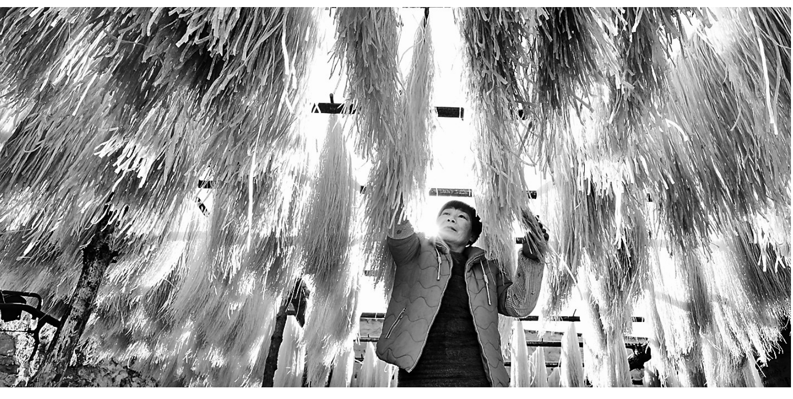
寒冬时节,丰润区西珠峪村村民趁着天气晴好,正在忙着加工晾晒粉条。该村是红薯种植、粉条加工专业村,拥有红薯粉条合作社,已形成集生产、加工、销售于一体的红薯粉条产业发展体系,粉条加工业成为村民增收的一条主渠道。

海洋环境污染问题表面在水里,根子在岸上。本着治水治海更要治岸理念,坚持标本兼治、清源治本,以陆源深度治理根除海洋污染顽疾。实施污染企业退城,加快市中心区及周边钢铁企业优化重组、搬迁启动,主城区280家陶瓷企业今年6月底前全部搬迁。到2020年,全部淘汰1000立方米以下高炉、100吨以下转炉和180平方米以下烧结机,从总量上减少污染排放。建立散乱污企业长效排查整治机制,确保实现动态清零。大力实施钢铁、焦化、煤电行业超低排放改造,全面执行严于国标省标的唐山限值,对未达标排放的一律依法停产整治。到2020年,全市钢铁企业烧结机排放颗粒物、二氧化硫和氮氧化物分别为5毫克/立方米、20毫克/立方米和30毫克/立方米。此外,精细精准整治面源污染,加强畜禽养殖污染防治,强化农村环境综合整治,深入推进农村生活污水、垃圾的收集处置,坚决消灭傍水农村污水、垃圾直排入河乱象。