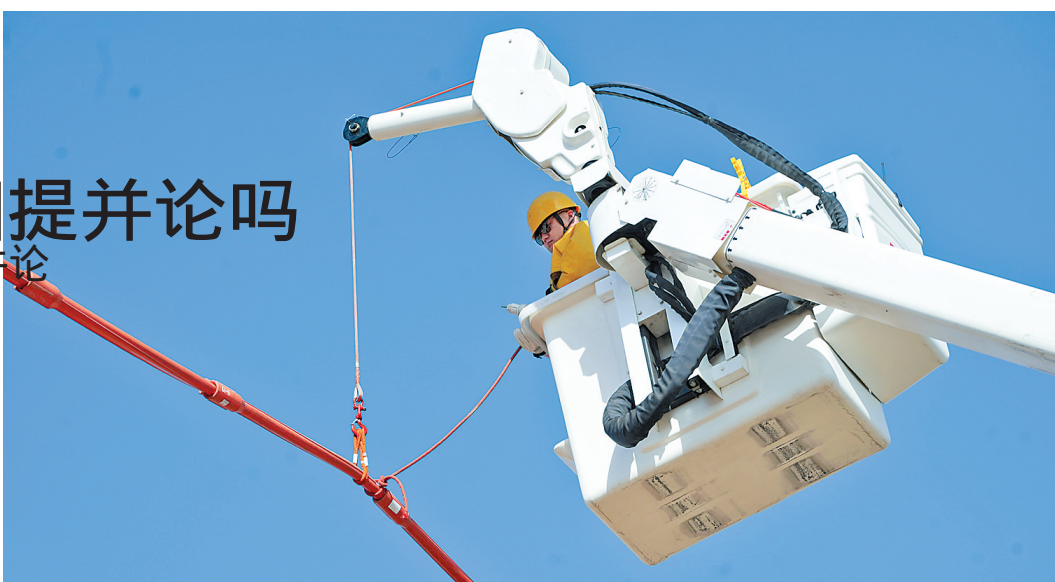
10月底,工人在隆尧县进行带电换杆作业,改造升级电网。隆尧县积极推进电代煤采暖工作,在减少污染的基础上,保障居民清洁取暖,守护蔚蓝天空。新华社发

据新华社北京11月27日电(记者高敬、胡璐)《中国应对气候变化的政策与行动2019年度报告》27日正式发布。在国务院新闻办举行的发布会上,生态环境部副部长赵英民说,中国应对气候变化工作取得明显成效。中国将继续发挥建设性作用,维护多边主义制度框架,全力支持即将召开的联合国气候变化框架公约第25次缔约方大会取得积极成果。