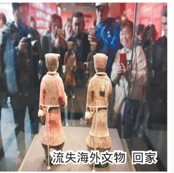
流失海外文物回家