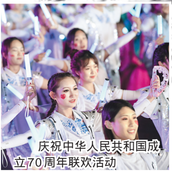
庆祝中华人民共和国成立70周年联欢活动

评析:4月15日,有着800多年历史的世界文化遗产巴黎圣母院因一场大火遭受重创,让世人扼腕。火灾后,中法文化遗产主管部门间多次函件来往,讨论合作设想。此次中法双方的合作不仅对两国意义重大,也对全世界的文物保护修复研究和国际合作交流做出了有益探索和积极示范。