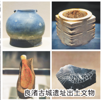
良渚古城遗址出土文物