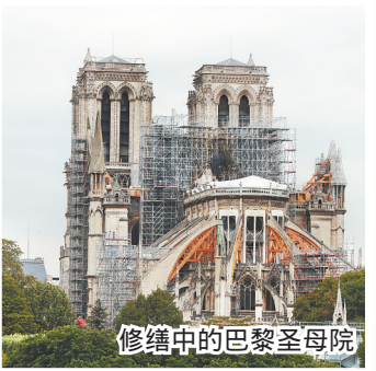
修缮中的巴黎圣母院