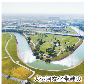
大运河文化带建设