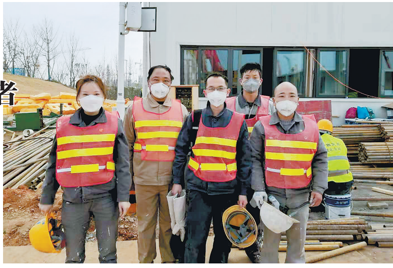
来自河北军辉安防科技股份有限公司的部分工人在武汉雷神山医院建设工地。

时间紧,任务重。按照项目建设要求,11人分成了白班和夜班,白班负责高空作业,夜班负责地面作业,24小时无缝衔接、全力施工。项目部