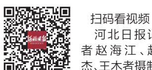
扫码看视频

河北日报讯(记者尉迟国利、陈宝云)1月31日,记者在承德市区各大超市看到,肉、蛋、奶、蔬菜等摆满了货架,各种生活必需品货源充足。