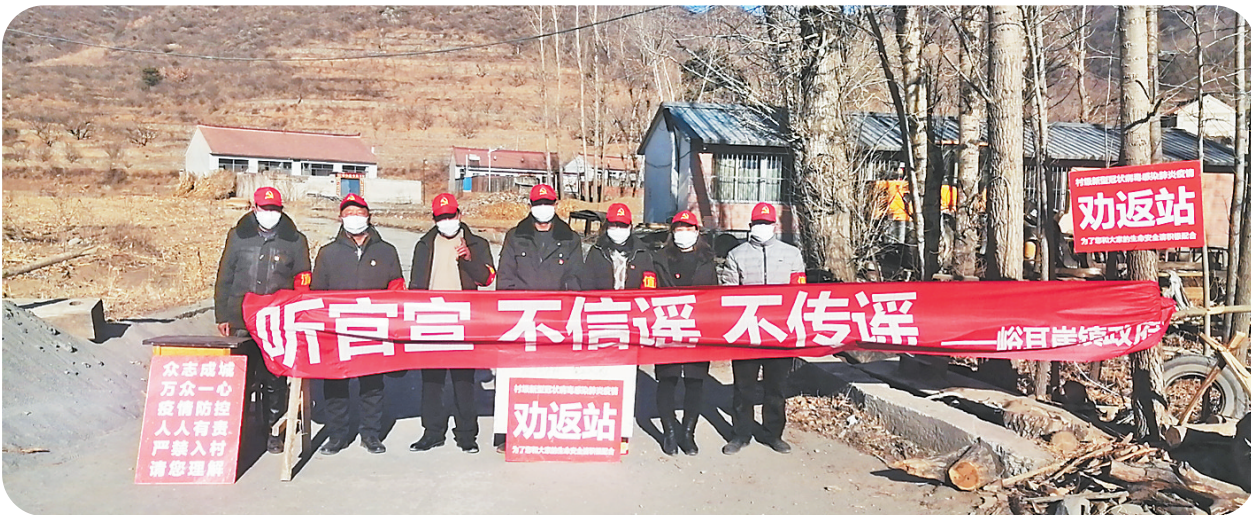
▲宽城满族自治县峪耳崖镇双洞子村9组是一个只有34户的小村,疫情发生以来,村里的党员轮流在村口值守,严控人员和车辆往来。