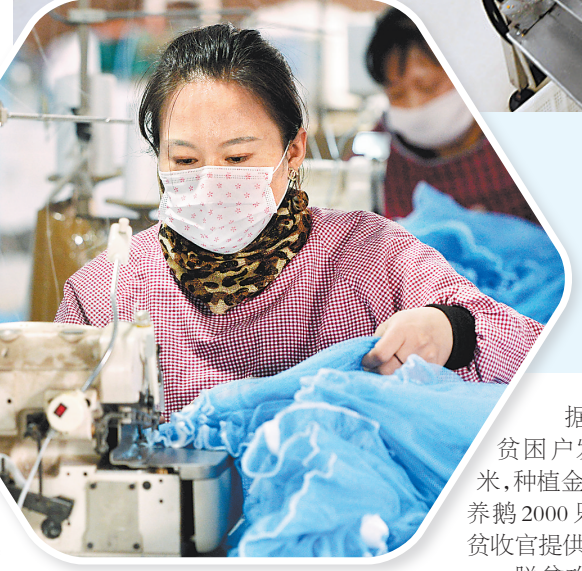
▲近日,阜城县一家扶贫车间的工人正在加工蚊帐。

据统计,目前该镇建档立卡贫困户发展庭院经济2万多平方米,种植金银花4500株、桃树2000株,养鹅2000只、养鸡1500只,为实现脱贫致富提供了保障。