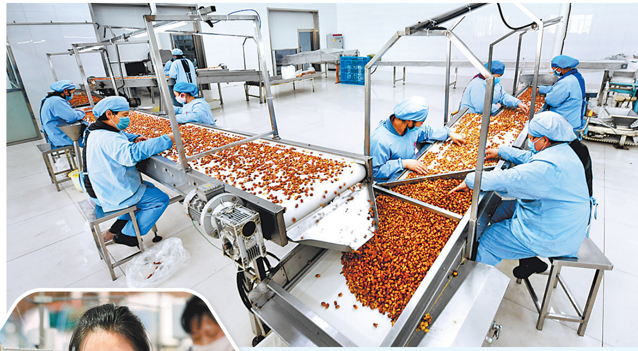
▲饶阳县鼓励企业对建档立卡贫困户,并设立扶贫专岗,让贫困户实现就近就近打工。这是在饶阳县振兴食品有限责任公

术,把全市各县(市、区)防贫信息和监测信息的上报、管理及部门支出记录统一纳入系统平台,监测对象因病就医、发生事故、因学、因灾出现家庭大额支出,金额超过设定的预警线时,系统自动生成预警台账并进行提示。系统还将防贫台账、预警台账与支出信息进行关联,缩短了相关信息查询统计时间,提升了工作效率和精准度,为全面做好防贫工作提供了科学有效的数据支撑