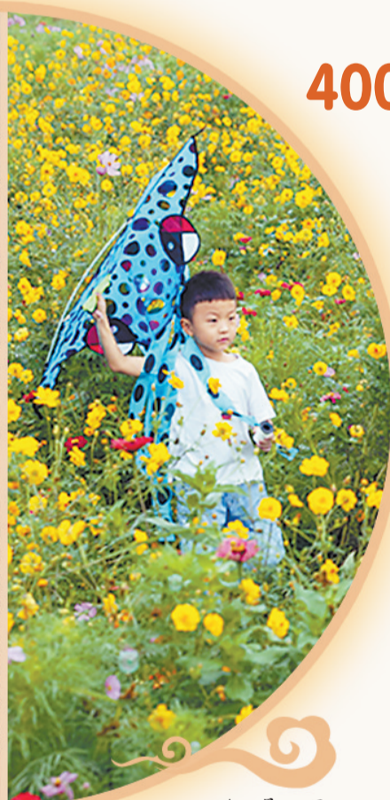
▲9月20日,衡水湖景区东湖大道两侧4000亩花卉竞相绽放。

近年来,衡水市滨湖新区坚持全域旅游发展理念,不断推动文化旅游产业实现新突破,推进5A景区创建。聘请高水平团队编制了《衡水湖环湖绿化规划及重点片区景观概念设计》,制定了《环衡水湖绿化工作方案》,将环湖绿化作为全市国土绿化的重点工程、国家森林城市创建的精品工程。今明两年,衡水湖将完成绿化面积3.15万亩,真正把衡水湖打造成“城市会客厅”。