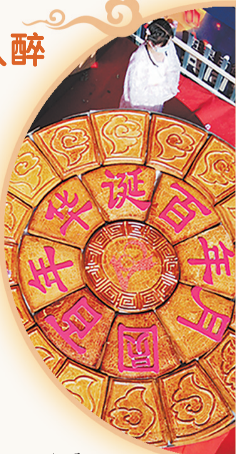
▲9月21日,正定旺泉古街,直径2.4米、重约500公斤的超大月饼出炉。

当人们还沉浸在音乐的盛宴中时,古城正定“百年华诞,月圆中秋”文化活动陆续登场。9月21日,在旺泉古街,直径2.4米的超级大月饼散发阵阵香气,引人垂涎,游客排队领取,品尝“团圆”的味道。在街区的簋街印象门口,中秋国庆同欢度文艺汇演也拉开帷幕。(下转第五版)