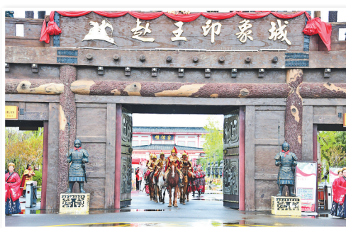
▲10月4日,广平县赵王印象城举办开城仪式。