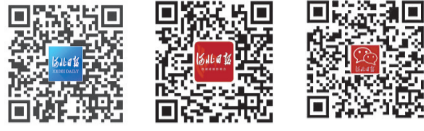
河北日报客户端、微博、微信