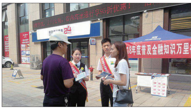
开展“2018年度普及金融知识万里行”活动