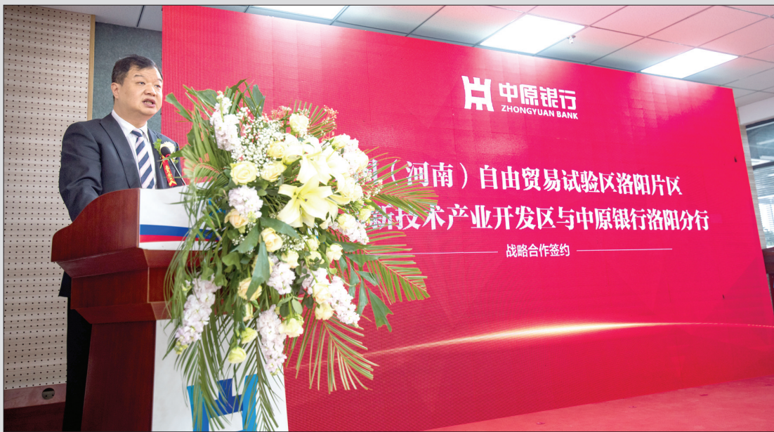
中原银行洛阳分行与中国(河南)自由贸易试验区洛阳片区、洛阳高新技术产业开发区签订支持地方经济战略合作协议

支持地方经济、扶持企业发展,都凝聚在这一份沉甸甸的成绩单中:截至2017年年末,中原银行洛阳分行贷款增长量位居全市单个金融机构第一名、中原银行系统第一名,贷款目标完成率位居全市第一名。同时,中原银行洛阳分行先后三次获洛阳市金融办通报表彰,在2018年度金融工作会上,获得“金融支持洛阳经济发展先进单位”和“银行业金融机构综合二等奖”两项殊荣。