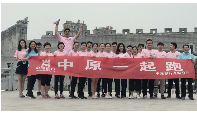
开展“中原一起跑”活动