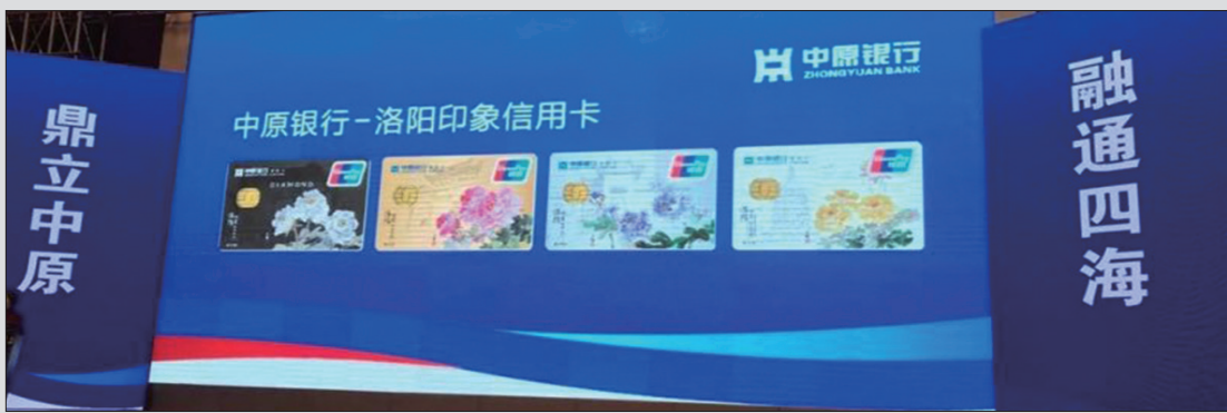
成功举办“鼎盛河洛”第一期经济论坛暨洛阳印象信用卡发布会