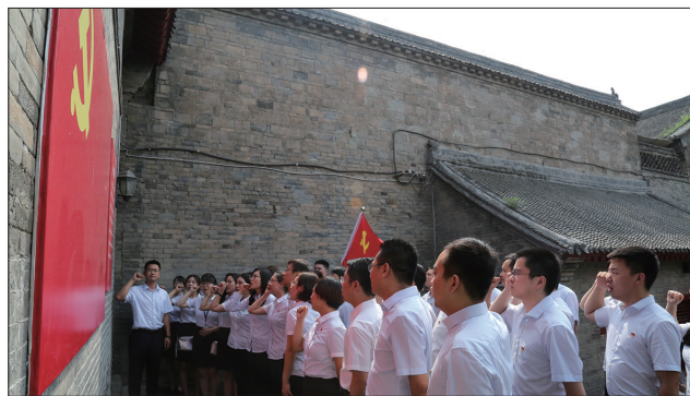
在八路军驻洛办事处开展重温入党誓词活动