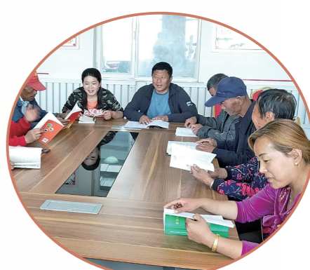
感受向阳村的乡村微治理模式。