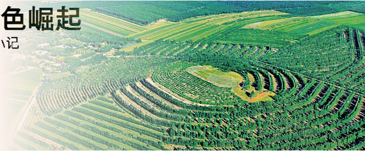
赤峰市敖汉旗三十二连山治理后绿色满山。