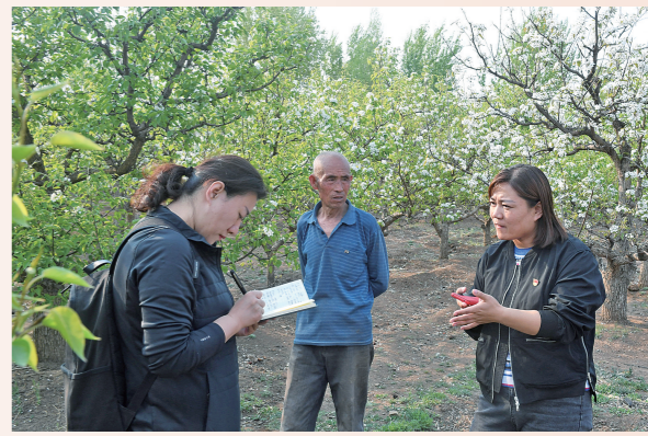
突泉县六户镇和胜村,记者采访果树种植带头人。