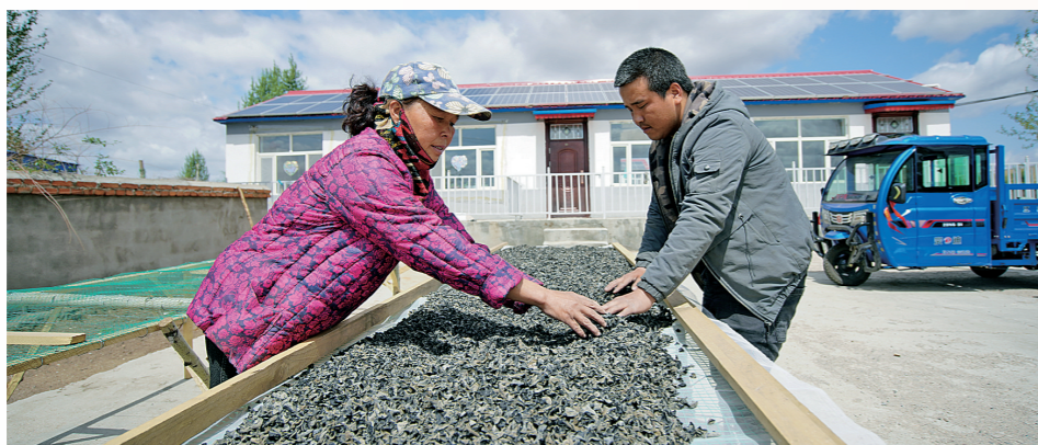
扎鲁特旗高品质黑木耳给农民带来好生活。