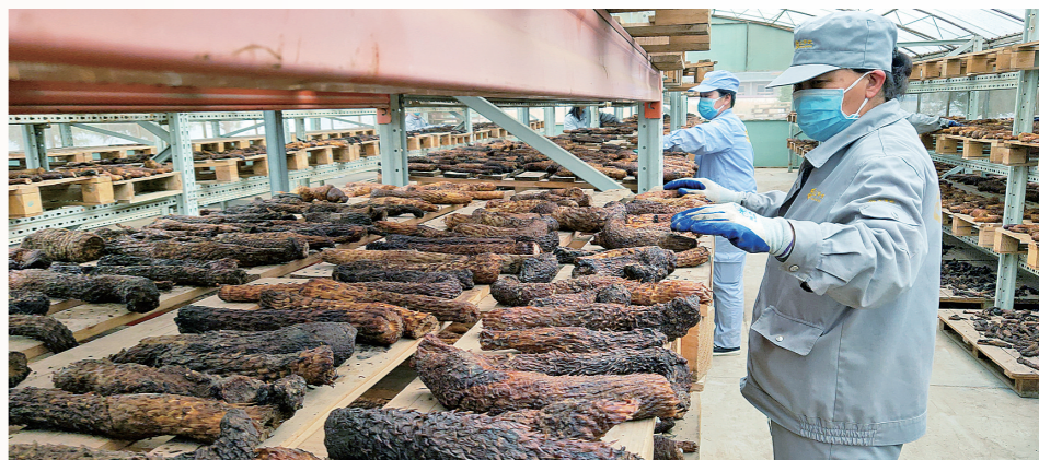
工人正在晾晒肉苜蓿。