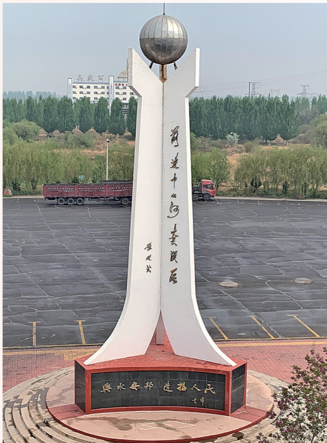
三盛公黄河水利枢纽是河套千万亩灌区的源头。

在“塞外明珠”乌梁素海,记者乘快艇巡湖,湖光山色尽收眼底,当地探寻各种方法综合治理乌梁素海,助力塞上江南、绿色崛起的新篇章。