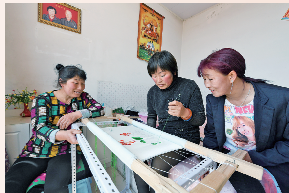
乌逊嘎查的妇女通过学习刺绣走上脱贫路。