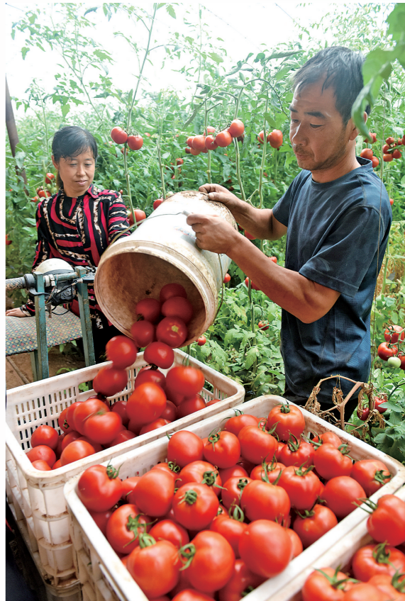
火红的柿子承载着农民致富的希望。