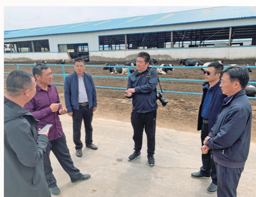
记者在杭锦旗太平乳业采访粪污资源化利用项目。