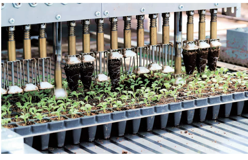
小草黑科技 全自动种苗生产线。