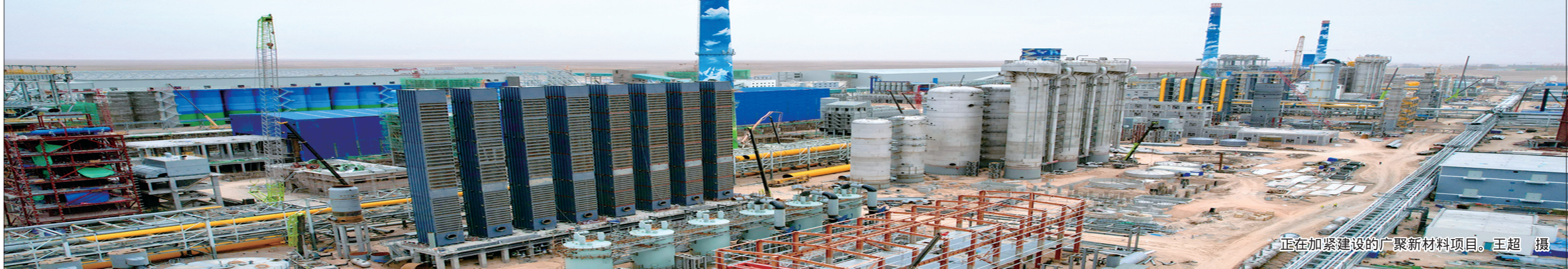
正在加紧建设的广聚新材料项目。

一手抓环境保护,一手推进生态建设。多年来,乌海市还举全市之力开展了大规模以防沙治沙为主的生态建设,经过近20年的不懈治理,乌海市林地面积、植被盖度不断增加,沙化荒漠化土地明显减少,风蚀沙化和水土流失情况得到有效遏制,从城内到城外,从山上到山下,乌海市整体生态面貌发生了历史性的变化,创造了“绿进沙退”的奇迹。截至目前,乌海市建成区绿化覆盖率达43%,人均公园绿地面积19.5平方米,乌海市先后跻身“全国绿化模范城市”“国家园林城市”“全国首批水生态文明城市”行列。