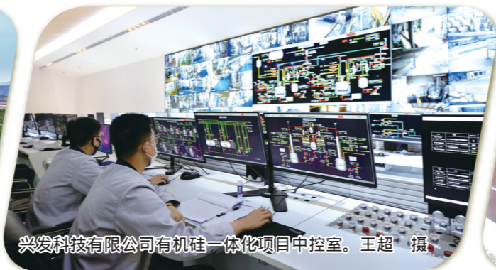
兴发科技有限公司有机硅一体化项目中控室。