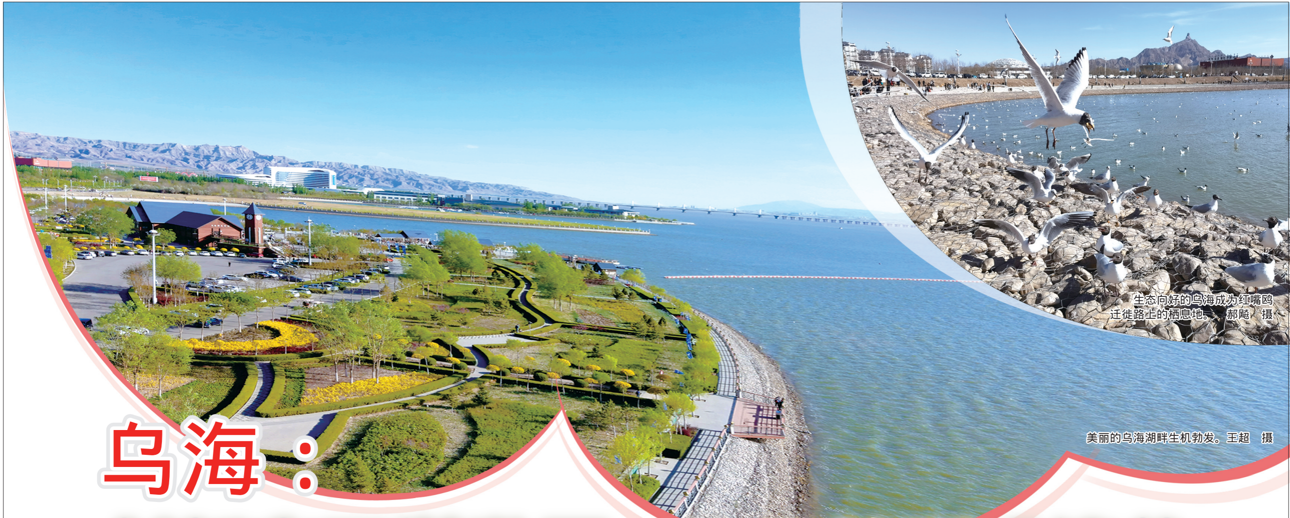
生态向好的乌海成为红嘴鸥迁徙路上的栖息地。