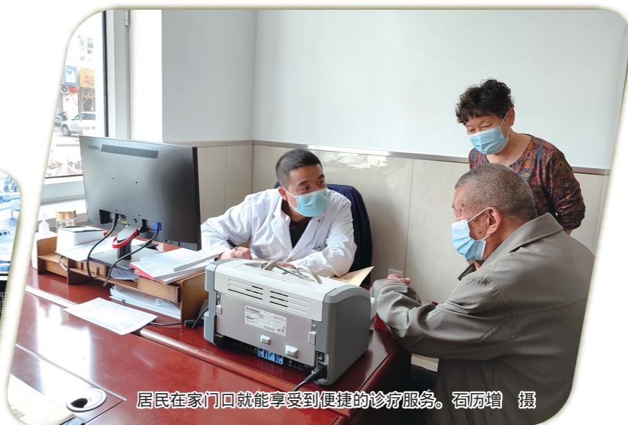
居民在家门口就能享受到便捷的诊疗服务。