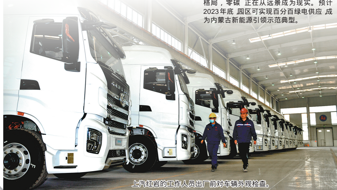
上汽红岩的工作人员出厂前对车辆外观检查。