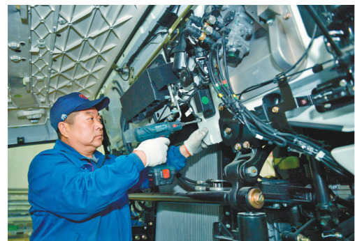
上汽红岩的工作人员正在加紧生产。