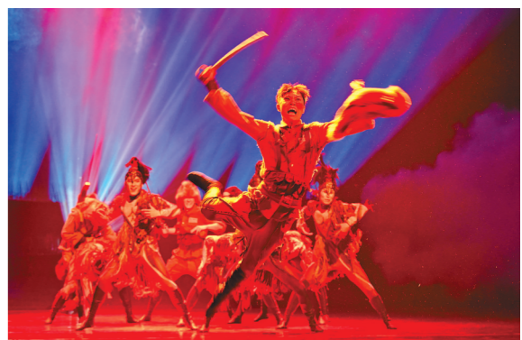
《凝固瞬间》 拍摄参数 ISO5000 F4 1/160s 82mm

舞台演出,灯光师会根据不同节奏的需要而采用不同光源的光线,来营造不同的气氛,舞台上光线色彩变化多端,时明时暗,让舞台摄影充满太多不确定性。本期选用照片虚实结合,利用快门速度,来拍摄各类有意境的图像,充分展示了舞台上的魅力。