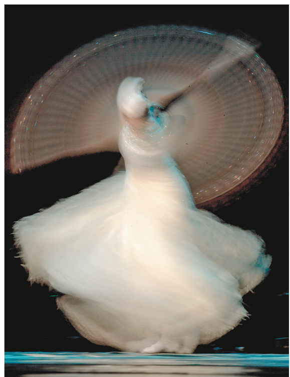
《诗意朦胧》 拍摄参数 ISO100 F29 1/3s 200mm