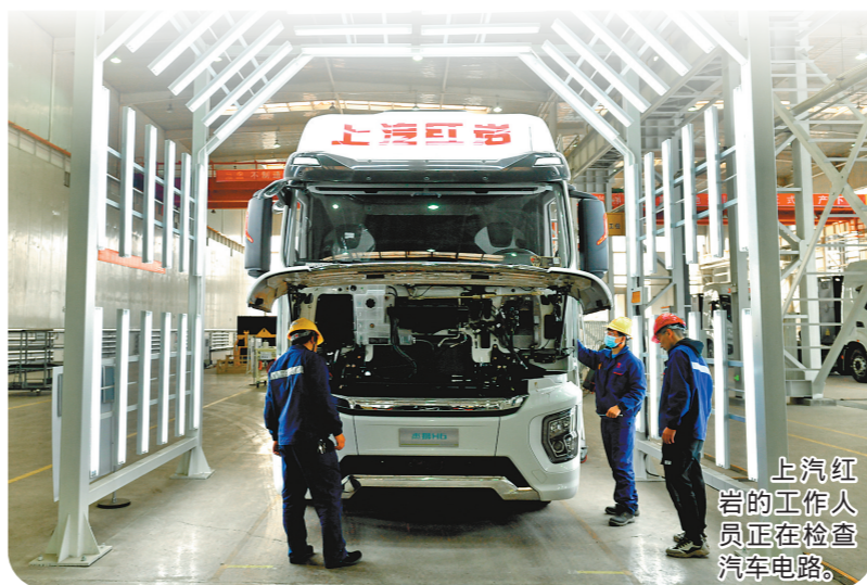
上汽红岩的工作人员正在检查汽车电路。