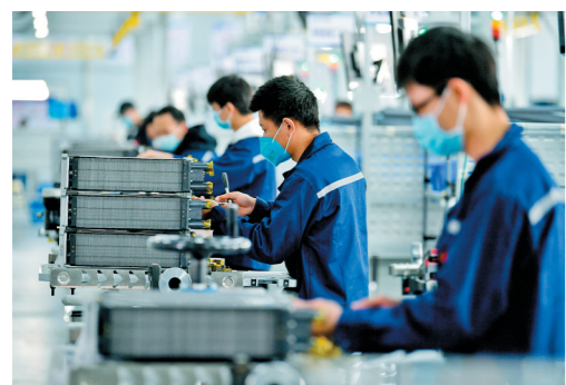
美锦国鸿氢能科技公司工作人员正在进行材料管路安装。