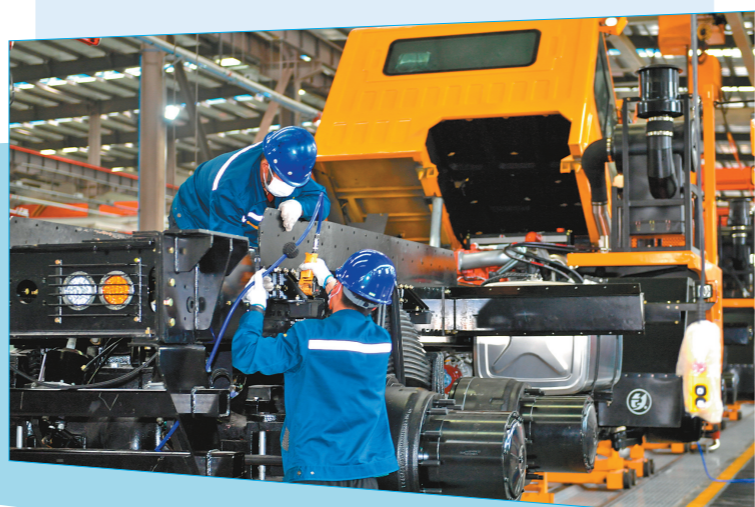
内蒙古铁辰智能装备有限公司的工作人员正在进行前簧安装。

近日,记者来到位于鄂尔多斯市伊金霍洛旗的蒙苏经济开发区,世界首创千亿元级零碳产业园就落地于此。目前零碳产业园聚集了上汽红岩、美锦国鸿氢能科技公司、内蒙古铁辰智能装备有限公司等多家龙头企业。园区围绕风光氢储车五大零碳产业集群,加快构建多能互补、多业并进、多点支撑、多元发展的新能源产业发展格局,零碳正在从远景成为现实。预计2023年底,园区可实现百分百绿电供应,成为内蒙古新能源引领示范典型。