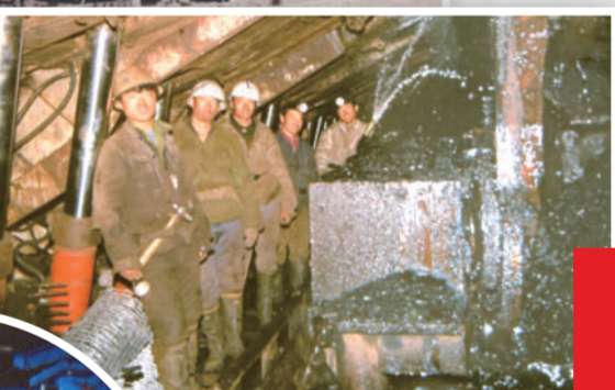
▲上世纪90年代,扎煤公司井下综采工作面。