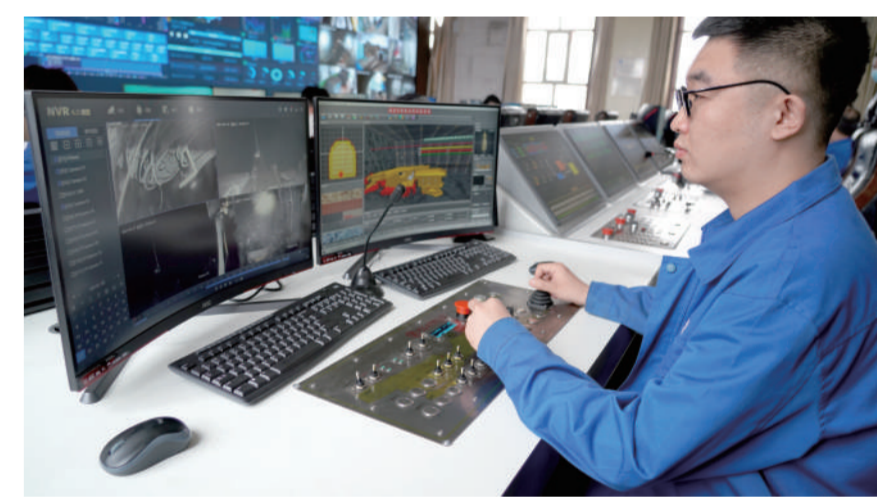
▲智能掘进系统井上远程控制。