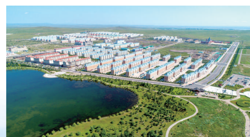
▲棚户区改造后,职工搬入新家。