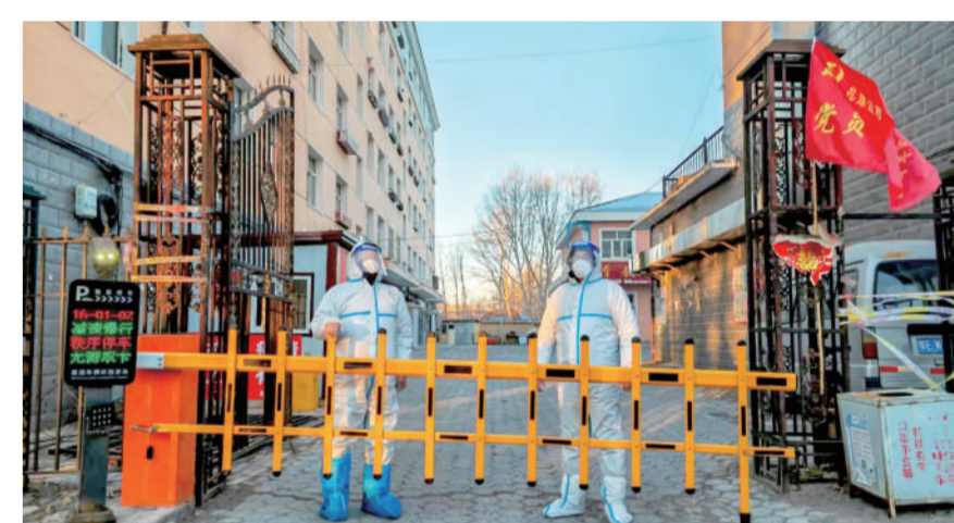
▲开展疫情防控志愿服务活动。

历史是一条不息的长河,发展是一曲豪迈的赞歌。站在“两个一百年”的历史交汇点上,扎煤公司将以习近平新时代中国特色社会主义思想为指导,立足新发展阶段、贯彻新发展理念、构建新发展格局,坚持做强做精煤炭主业,坚持向清洁能源绿色转型,坚持全面深化企业内部改革,努力把扎煤公司建设成为具有区域竞争力综合能源企业,为助力东北振兴和落实国家能源安全新战略作出新的、更大的贡献!