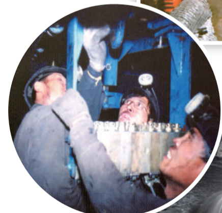
▲2000年前后,扎煤公司在质量标准化工作方面取得的成效日益显现。