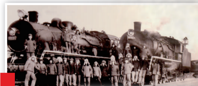
▲上世纪80年代以后,扎赉诺尔矿区因使用上游型蒸汽机车数量多、规模大,被誉为“上游的天空”。