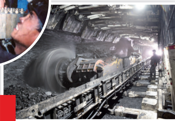
▲随着扎煤公司不断发展壮大,设备机械化程度不断提高,煤炭生产能力逐年攀升。