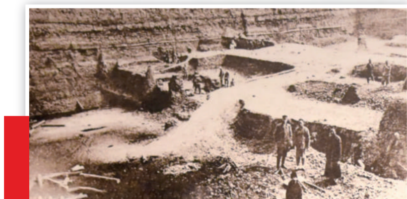
▲1902年,建设中的“波洛尼科夫矿”。