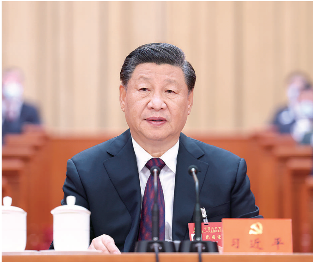
10月22日,中国共产党第二十次全国代表大会在北京人民大会堂胜利闭幕。习近平同志主持大会。

习近平强调,中国共产党走过了百年奋斗历程,又踏上了新的赶考之路。一百年来,党团结带领全国各族人民取得了新民主主义革命、社会主义革命和建设、改革开放和社会主义现代化建设的伟大胜利,开创了中国特色社会主义新时代。百年成就无比辉煌,百年大党风华正茂。我们完全有信心有能力在新时代新征程创造令世人刮目相看的新的更大奇迹。全党要紧密团结在党中央周围,高举中国特色社会主义伟大旗帜,坚定历史自信,增强历史主动,敢于斗争、敢于胜利,埋头苦干、锐意进取,团结带领全国各族人民为实现党的二十大确定的目标任务而奋斗