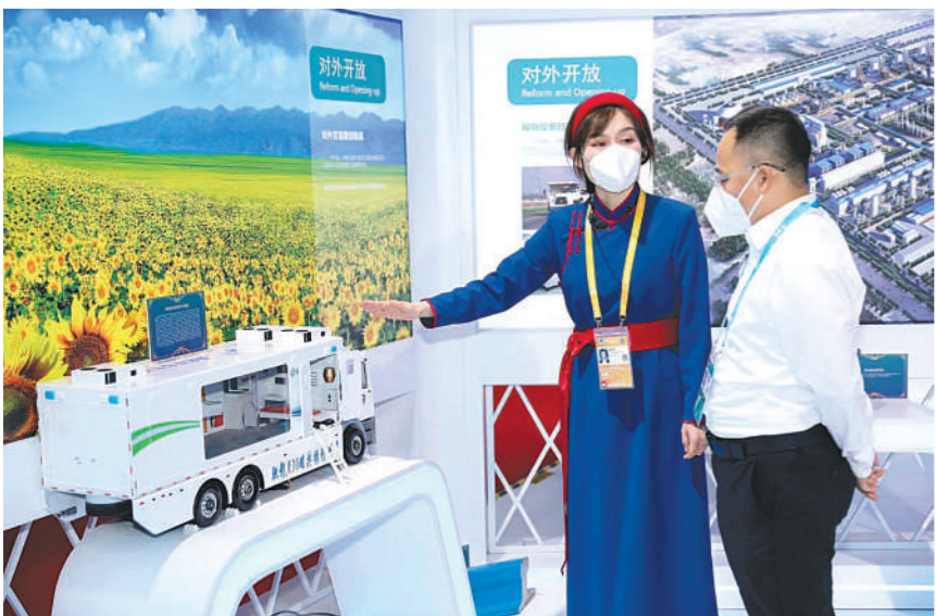
在第五届中国国际进口博览会现场,讲解员向参观者介绍内蒙古研发生产的我国首台具有自主知识产权的磁共振诊疗车。

本报11月5日讯(记者 高慧) 11月5日,第五届中国国际进口博览会在上海国家会展中心开幕。内蒙古举办的系列活动精彩亮相进博会。活动通过展览展示、现场品鉴、品牌宣传等方式,展示内蒙古开放新优势,让进博会展商和宾客了解内蒙古、感受内蒙古、爱上内蒙古。