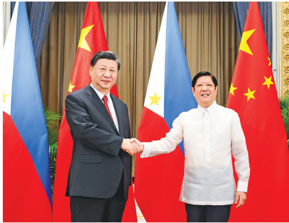
当地时间11月17日下午,国家主席习近平在泰国曼谷会见菲律宾总统马科斯。