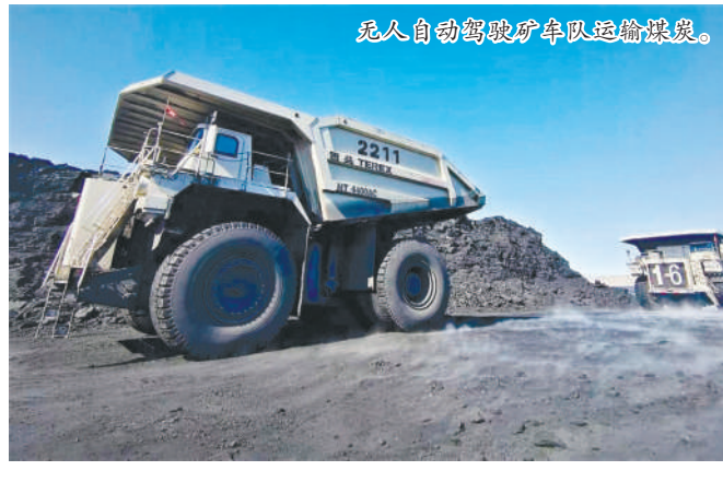
无人自动驾驶矿车队运输煤炭。

该公司抓实露天煤矿车辆运输、边坡监测、采场防火等工作,和井工矿工作面顶底板支护、“一通三防”等管理,加大储装和生产设备巡检、维护力度,保证地面生产系统安全高效运行,加强与铁路部门沟通,加大运输组织力度,合理调整地销煤量、铁路外运量比例,最大化利用铁路运力,最优化组织汽运,确保煤炭外运稳定,全力以赴保障东北和蒙东区域民生用煤需求和人民群众温暖过冬。截至目前,雁宝能源年累计生产原煤完成2972.72万吨。