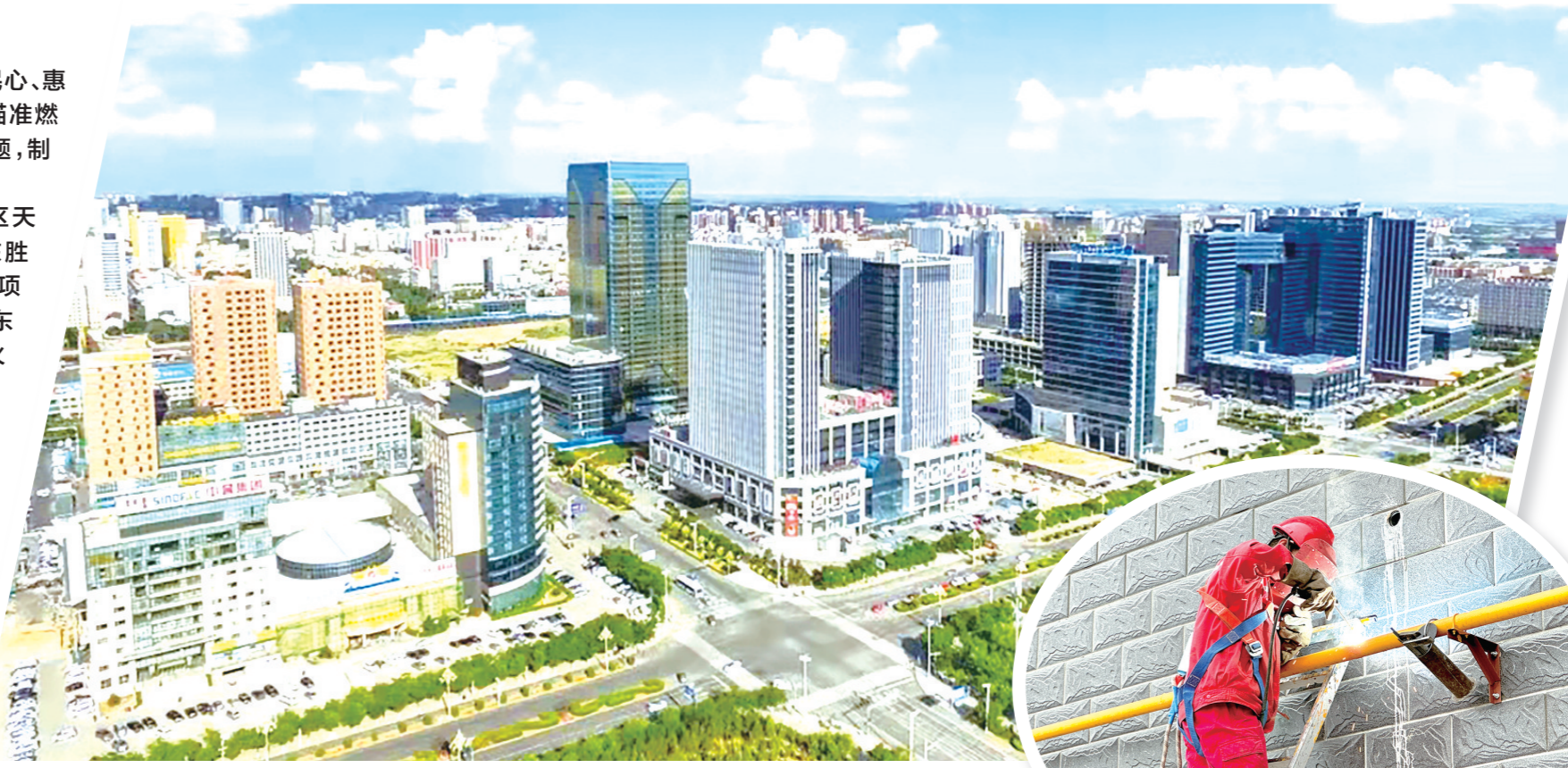
惠民生、暖民心、顺民意,鄂尔多斯市东胜区一直在行动。

不到两个月,东胜区就将新春第一会上制定的一个个工程项目落到了实处。究其原因,是东胜区委、区政府始终坚持将“温暖工程”置顶,锚定“蓝图”,躬身实干,让“温暖工程”的各项工程做到了早早“开拔”,努力让百姓的幸福生活快速“升温”。