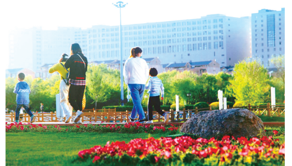
鄂尔多斯市东胜区紧扣“温暖工程”脉搏,将民生实事“置顶”,让幸福生活“升温”。

2024年,东胜区将全力推动40个供暖重点项目加快改造建设。截至目前,东胜区惠和供热馨雅如换热站改造项目、蒙泰智慧供热换热站升级改造、东蒙物业有限公司换热站智慧供热改造工程等22个项目已具备复工条件,待采暖期停暖后开工建设,其余项目正在加快手续办理,力争于9月中旬全部完工,所有项目完工后将全面提升城市供热保障能力和水平。